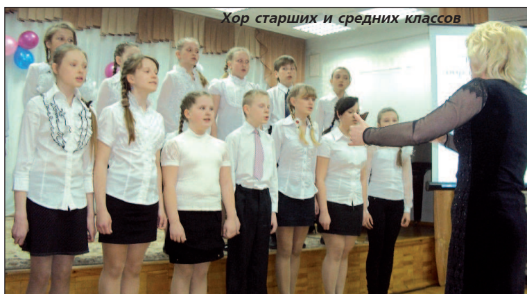
Хор старших и средних классов

"Искусства волшебный свет" - так был назван праздничный концерт и выставка, посвященные 15-летию ДШИ №2. Свет ее окон горит и освещает не только физическое пространство района станции Гороблагодатская. Он освещает жизнь каждого ребенка, ставшего в один поистине прекрасный день своей жизни ее учеником.