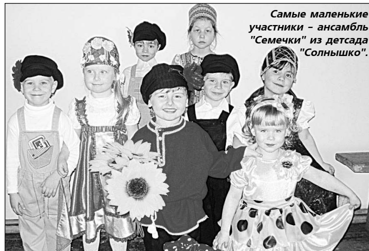
Самые маленькие участники - ансамбль "Семечки" из детского сада "Солнышко".

ЭТОТ фестиваль по праву можно назвать смотром юных дарований. В пятый раз он проходил в ЦКид, собрав 480 участников, начиная с детского сада и заканчивая молодежью старше 15 лет.