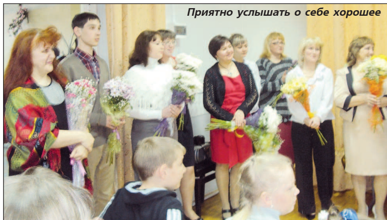
Приятно услышать о себе хорошее

КАЖДЫЙ юбилей - это, прежде всего, большой, красивый праздник, который отражает достигнутое и тем самым дает возможность взглянуть на пройденный юбиларом путь. Праздник, который немислим без номинирования, называния одного за другим шагов этого пути. А если юбилей - детская школа искусств, то и юбилей ее столь же прекрасен и полон света и творчества, как и тот предмет, который и составляет жизнь школы - искусство.