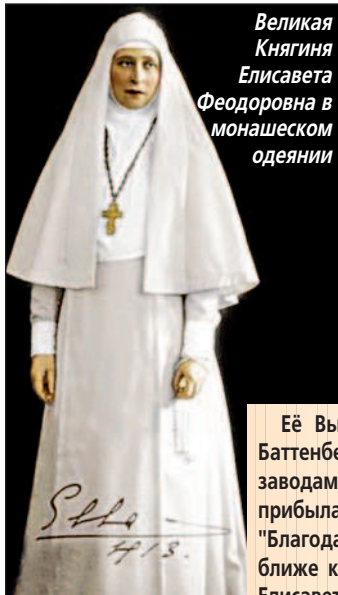
Великая Княгиня Елисавета Феодоровна в монашеском одеянии

Через 36 лет “Путеводитель по Уралу” уже прямо приглашал туристов посетить горный музей, который находился на горе Благодать “в здании управления ея и рудников округа. Помимо образцов и геологических пород, моделей, инструментов и приборов для алмазного бурения, музей заключает весьма ценную коллекцию образцов пород от разведочного бурения и исследования горы Благодати с прекрасно составленными и иллюстрированными журналами. Все буровые скважины занумерованы (их более 100) и образцы взяты с каждого фута их глубины, так что представляется полная возможность найти образец породы и руды с