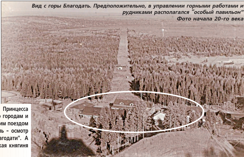
Вид с горы Благодать. Предположительно, в управлении горными работами и рудниками располагался “особый павильон” Фото начала 20-го века