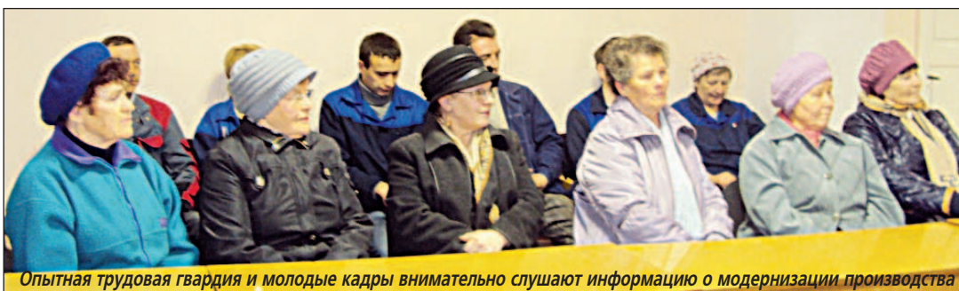
Опытная трудовая гвардия и молодые кадры внимательно слушают информацию о модернизации производства

Спасибо им, что пришли. (Окончание на 13-й стр.)