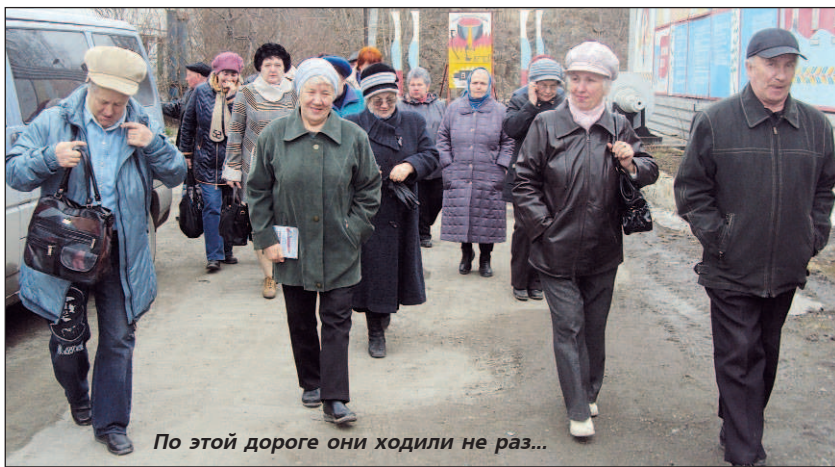
По этой дороге они ходили не раз...