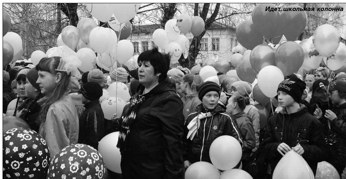
Идет школьная колонна

В ЭТОМ году баранчинцы несколько отступили от давней традиции, и вместо Первомайской демонстрации, провели праздничное шествие по центральной улице Коммуны. Оно завершилось, несмотря на накрапывающий дождь, митингом на площади администрации поселка с концертными номерами.