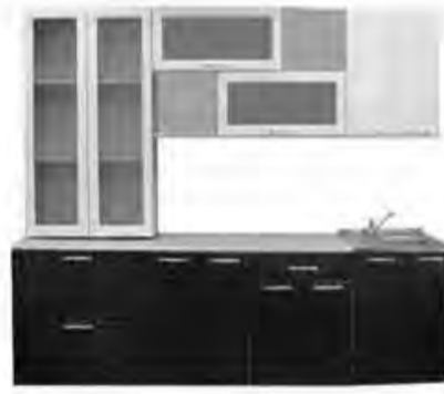
2,6 м - 27 660 р.