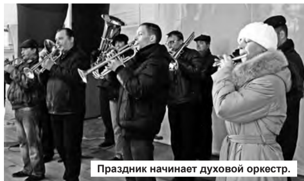
Праздник начинается духовой оркестр.

А потом был добротный более чем двухчасовой концерт, который тоже был символом единства: на одной сце-