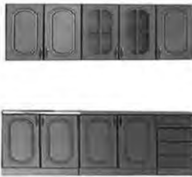
2 м - 11 970 р.