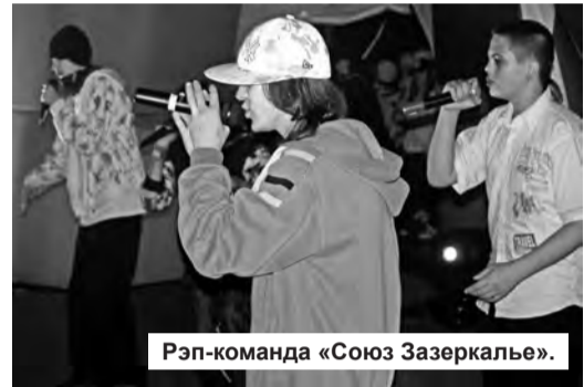
Рэп-команда «Союз Зеркалье».