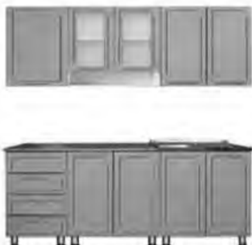
1,6 м - 10 600 р.