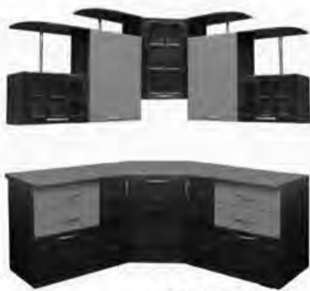
1,6*1,6м - 29 480 р.