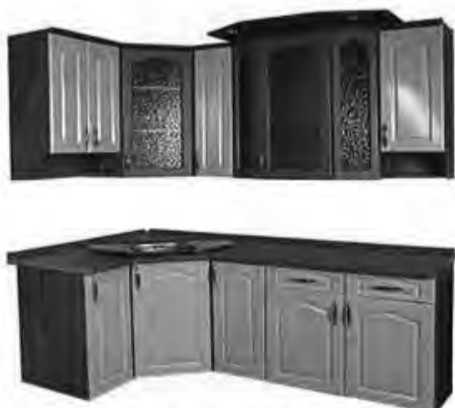
1,6*0,8м - 27 640 р.