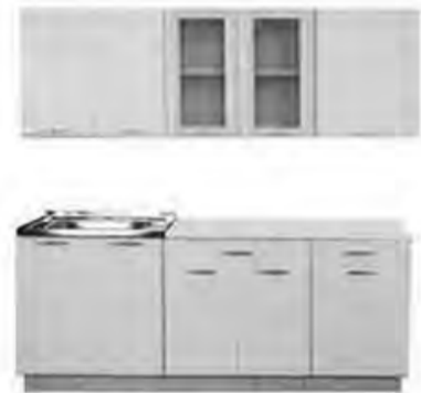
1,6 м - 8 980 р.