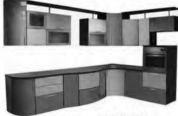
3*2м - 60 360 р.