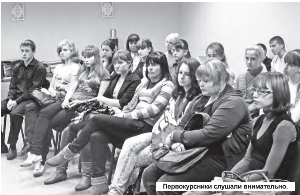
Первокурсники слушали внимательно.