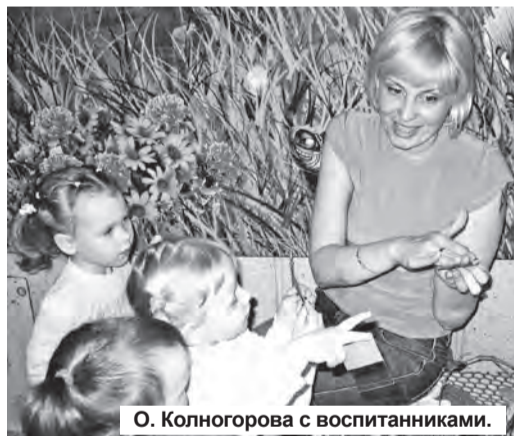
О. Колногорова с воспитанниками.

Наталья ФРОЛОВА. Фото из архивов ДОУ Лесного.