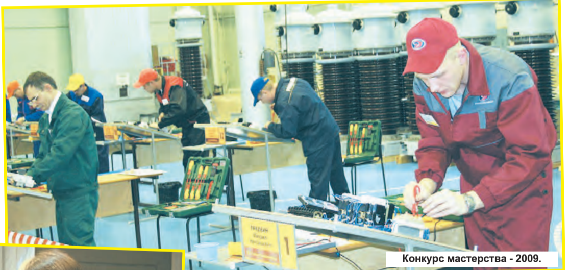
Конкурс мастерства - 2009.

65 лет назад наша страна начала работу над Советским атомным проектом. Это событие ознаменовало создание атомного ведомства. За прошедшие годы не раз менялись его названия – Первое главное управление, Минсредмаш, Минатом, Росатом, но неизменными оставались задачи по обеспечению национальной безопасности и ядерного суверенитета в мире. Глубина и масштабность научных исследований в рамках Советского атомного проекта формировали прорыв