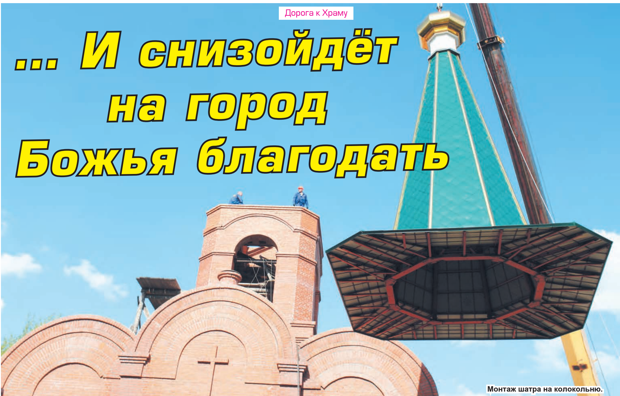
Монтаж шатра на колокольню.

13 августа старания всех, кто объединил усилия для продолжения строительства храма в Нижней Туре, увенчались важным и радостным событием. В этот вечер десятки верующих, руководство городской администрации, благотворители собрались у храма, чтобы стать участниками исторического момента – увенчания храма куполами и крестами.