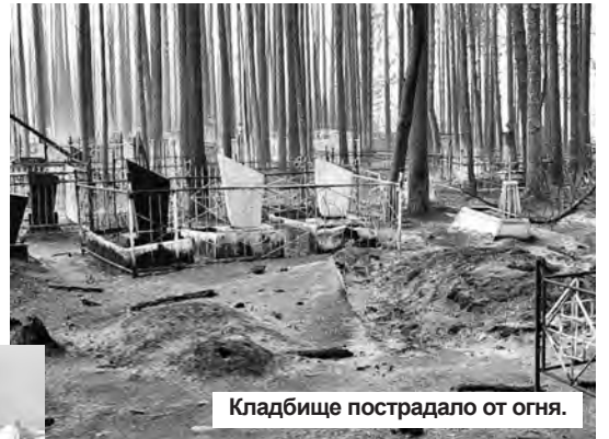
Кладбище пострадало от огня.

Ситуация с лесными пожарами в районе Снежинска Челябинской области, где находится Федеральное ядерное центр, сегодня также полностью стабилизирована. Напомним: лесной пожар вблизи Снежинска вспыхнул 7 августа, его площадь составила 10 га. На тушении пожара рабо-