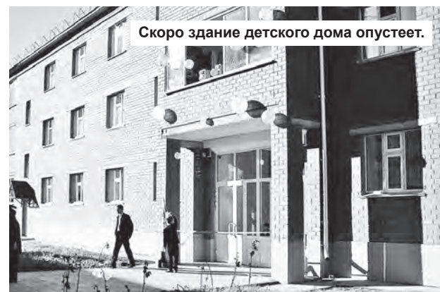
Скоро здание детского дома опустеет.

Жанна РОЖДЕСТВЕНСКАЯ.