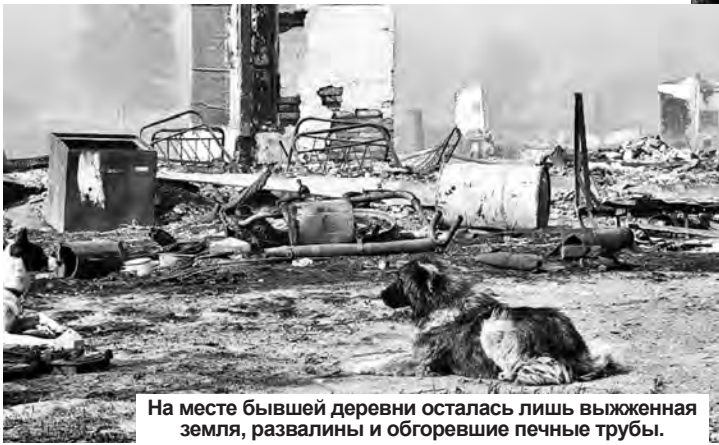
На месте бывшей деревни осталась лишь выжженная земля, развалины и обгоревшие печные трубы.

Что касается других ЗАТО, то, действительно, огонь подбирался и к Сарову, и к Снежинску. Так,