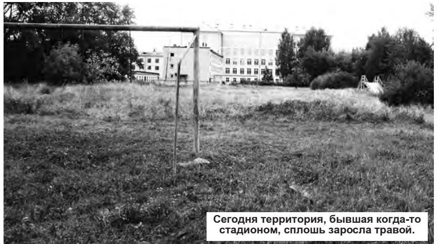
Сегодня территория, бывшая когда-то стадионом, сплошь заросла травой.

Жанна РОЖДЕСТВЕНСКАЯ.