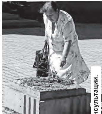
Печальный вид у женской консультации.