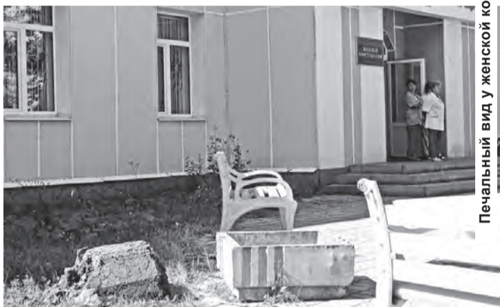
Печальный вид у женской консультации.