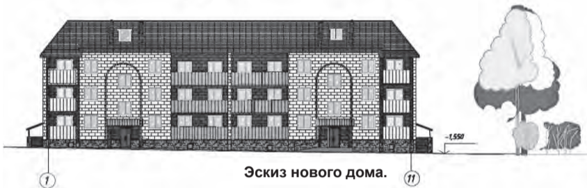
Эскиз нового дома.

гие квартиры приватизированы) земля была передана СП ОАО СУС, утром 4 июня застройщик получил разрешение на начало строительства.