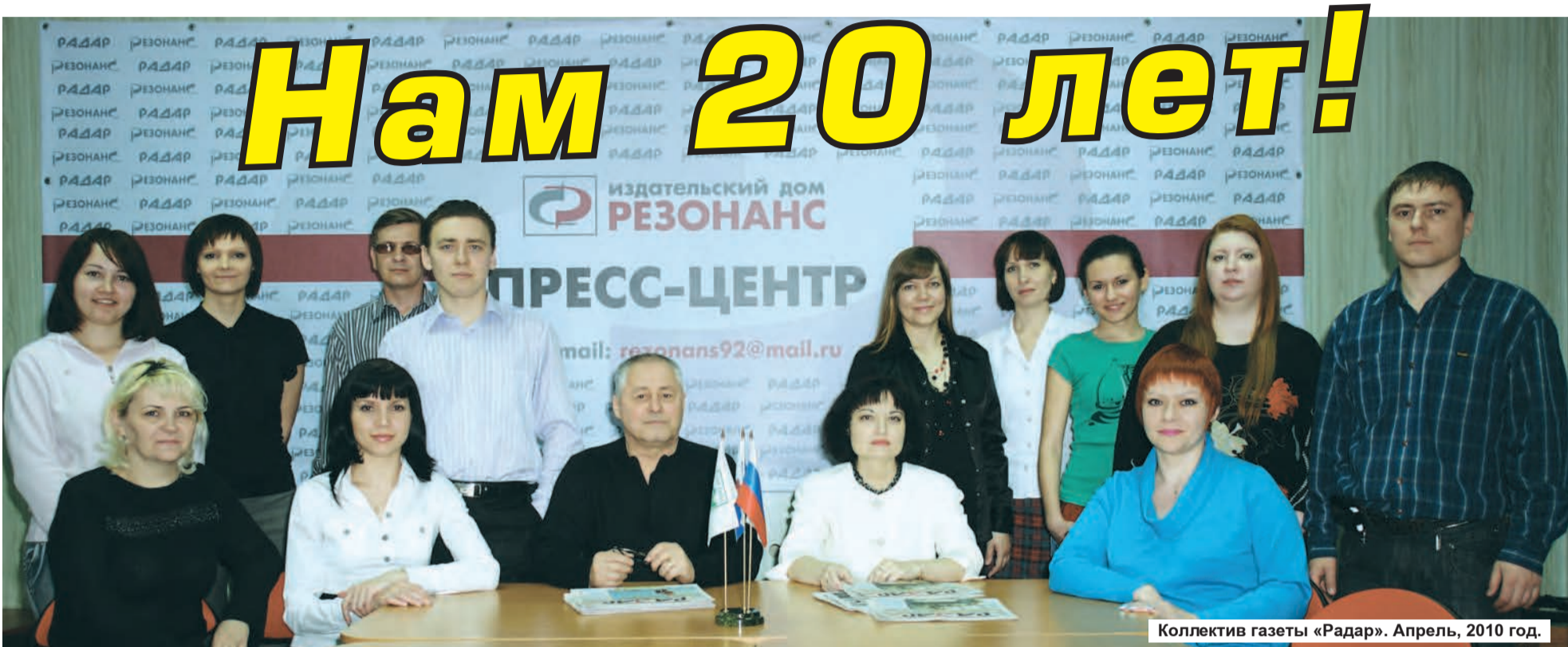
Коллектив газеты «Радар». Апрель, 2010 год.