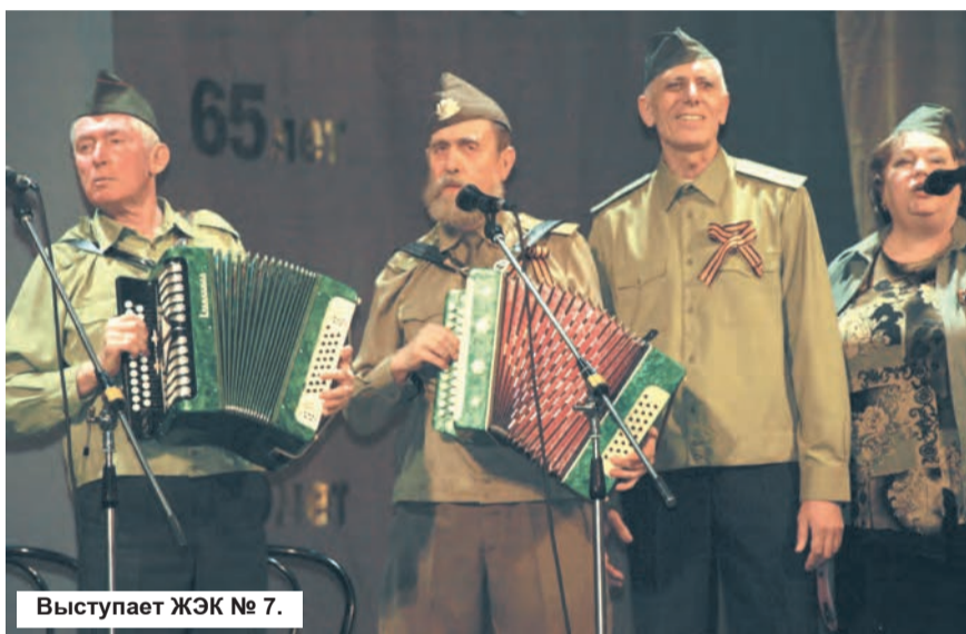
Выступает ЖЭК № 7.

Татьяна САИТОВА, редактор отдела культуры г. Лесного.