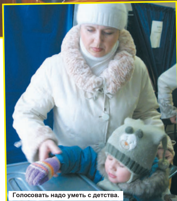
Голосовать надо уметь с детства.