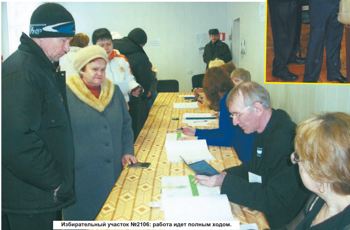
Избирательный участок №2106: работа идет полным ходом.