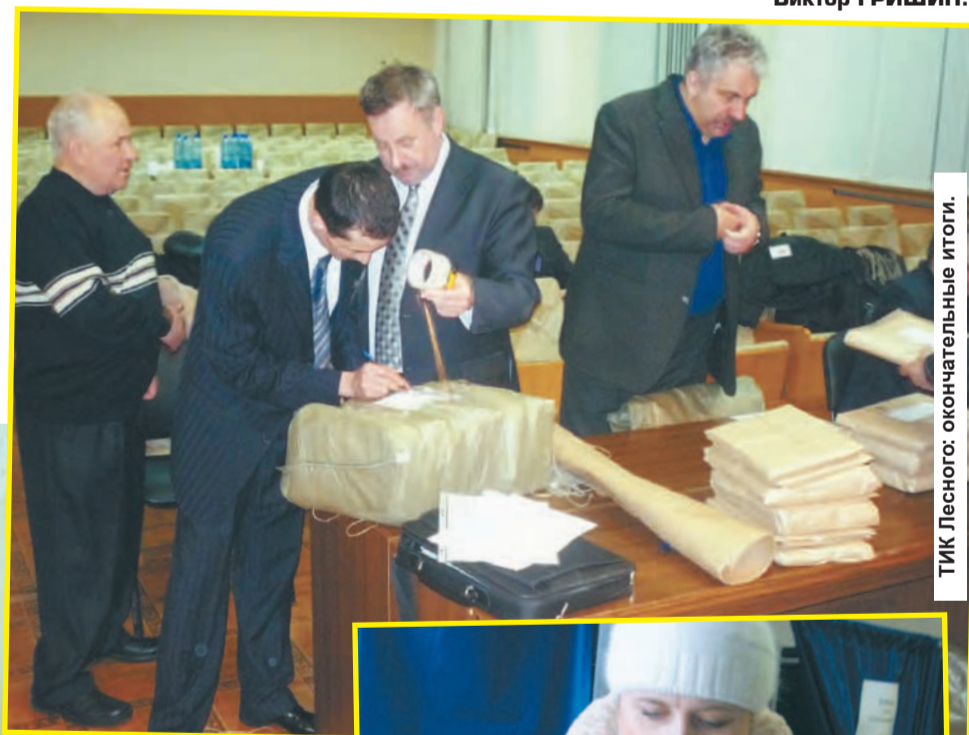
ТИК Лесного: окончательные итоги.