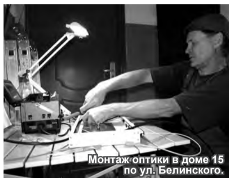
Монтаж оптики в доме 15 по ул. Белинского.