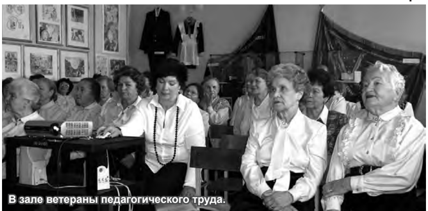
В зале ветераны педагогического труда.