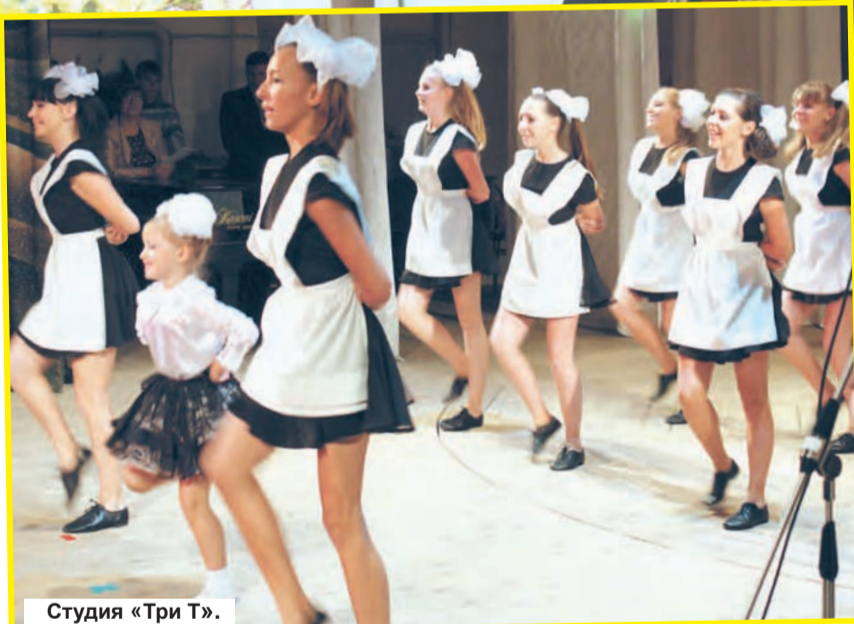
Студия «Три Т».

Окончание на стр. 3.