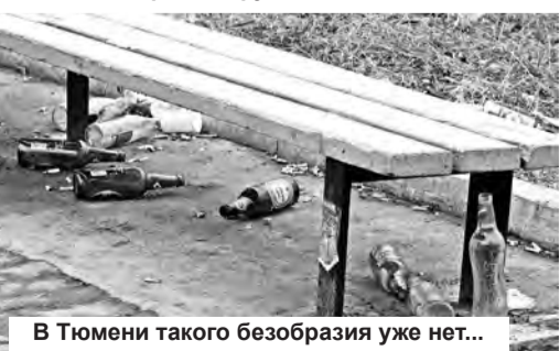
В Тюмени такого безобразия уже нет...

Возможна ли такая практика в нашем городе? Что думают об этом наши депутаты, наш глава и горожане? Приглашаем всех неравнодушных читателей к разговору.