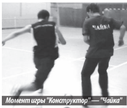
Момент игры «Конструктор» — «Чайка»

Но главное внимание болельщиков было приковано к «финалу четырех». Первыми 2 октября на площадку вышли «Арсенал» и «Символ». После первого тайма «Символ» повел в счете благо-