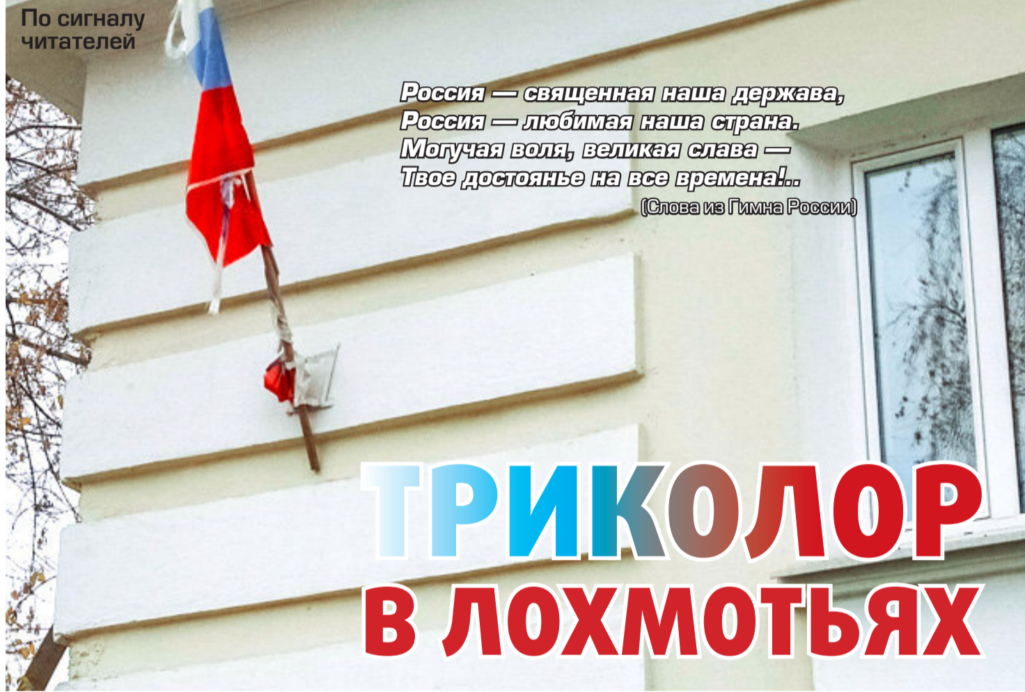
По сигналу читателей

Россия — священная наша держава, Россия — любимая наша страна. Могучая воля, великая слава — Твое достоянье на все времена!.. (Слова из Гимна России)