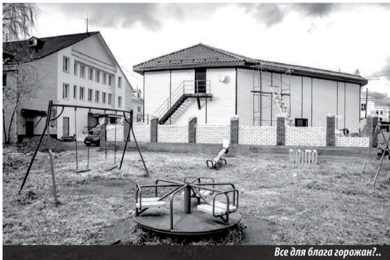
Все для блага горожан?..

Далее, поскольку у склада земельный участок был только в пределах фун-