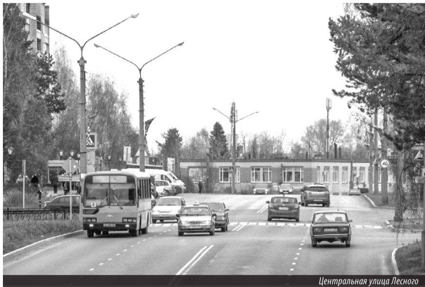
Центральная улица Лесного