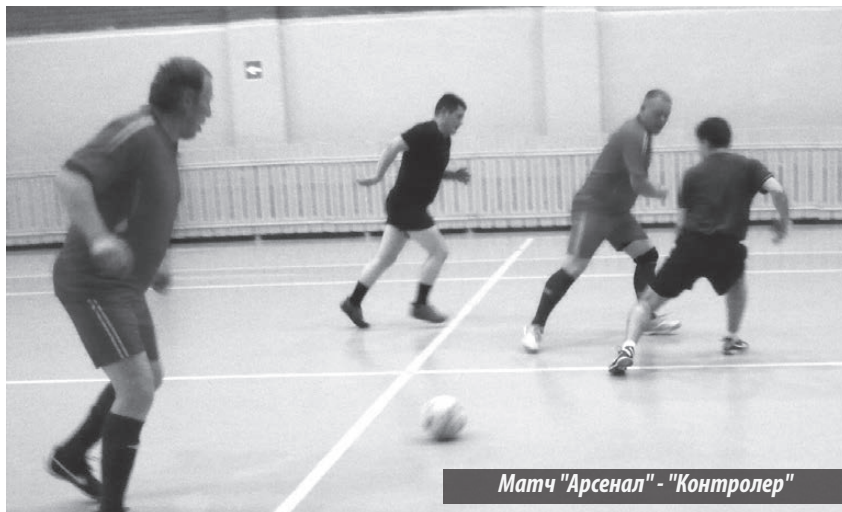
Матч "Арсенал" - "Контролер"