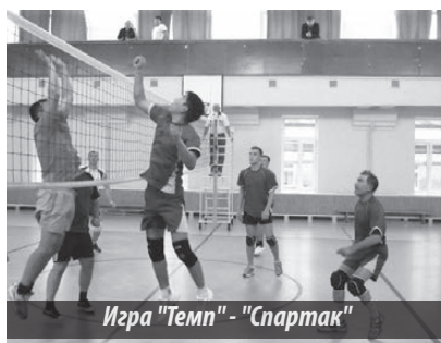
Игра "Темп" - "Спартак"