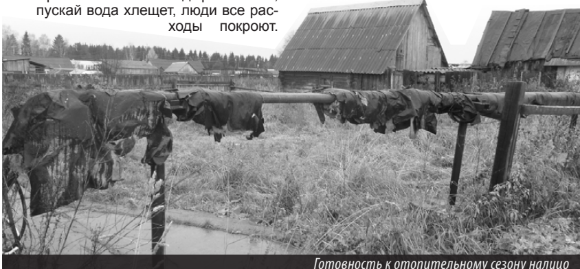
Готовность к отопительному сезону налицо

прошлый сезон-2013 начисления за полив одного из участков по ул. Краснофлотской составили более 10 тыс. руб! В этом - свыше 6 тыс. рублей. Причем услуги «золотого» полива охочие и пидкие на народный рубль коммунальщики предпочитают оказывать с 1 мая по 31 августа. «Это же чистойшей бред!» - негодуют жители. - «В мае вообще никто ничего не поливал, ровным счетом, как и на протяжении всего лета. Дожди хлестали почти каждый день. У нас картошка сгнила от постоянных осадков, а они нам еще полив приписали! Да мы утонули бы по самые уши, если бы им вдобавок пользовались. Где логика?.. Кроме того, представители ЖКХ, по-видимому, забылись, где мы живем. Это на югах урожай начинают собирать чуть ли не с апреля. У нас - на Урале, да будет им известно, в мае только первые посадки начинают, да и то, смотря, какая погода за окном. Не менее интересен вопрос с площадью, на которую они рассчитывают полив. Учитывают буквально всю, которая не под крышей (!), включая ту, где грядки отсутствуют. 30 лет не было никакого полива, а тут нате - решили отыграться! Хорошо устроились покрывать таким «макарон» собственные потери в сетях. Правильно, зачем работать и латать дыры на них, пускай вода хлещет, люди все расходы покроют.