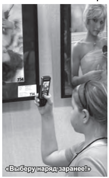
«Выберу наряд заранее!»