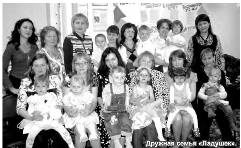
Дружная семья «Ладушек».

Подготовила Светлана ЩИПАКОВА.