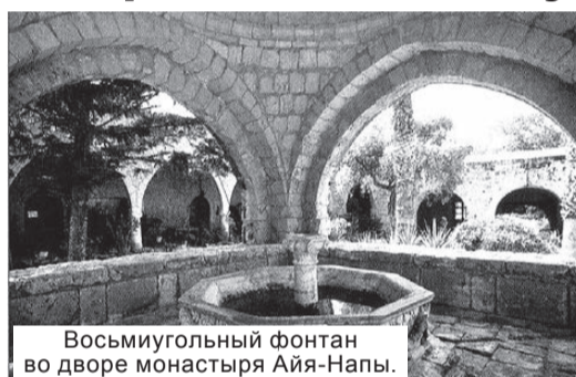
Восьмиугольный фонтан во дворе монастыря Айя-Напы.

В центре монастырского двора находится восьмиугольный фонтан в стиле Ренессанс, украшенный мраморными барельефами и увенчанный куполом на четырех колоннах. Вода, поступающая по римскому акведуку, вытекает из мраморной головы дикого кабана.