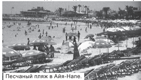
Песчаный пляж в Айя-Напе.