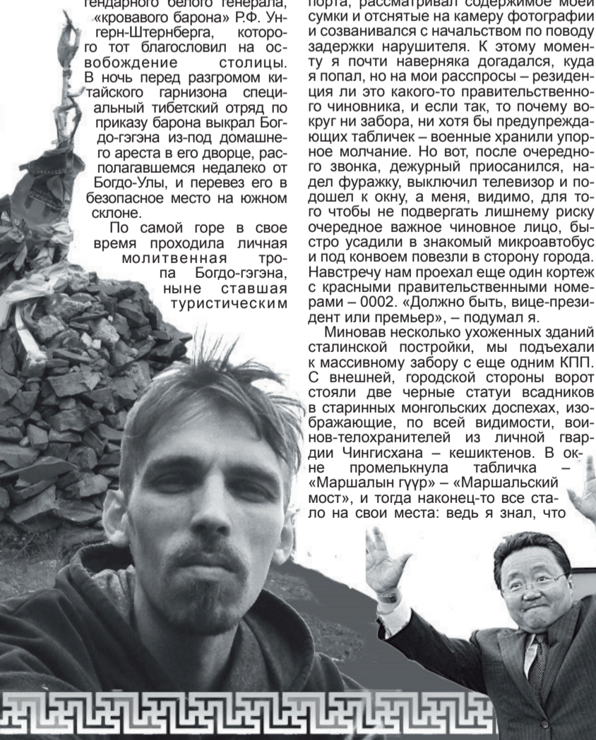
Курган на одной из вершин Богдо-Хан-Улы. | С. Куваев. | Президент Монголии Ц. Элбэгдорж | Здание Главного разведывательного управления.