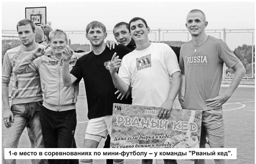
1-е место в соревнованиях по мини-футболу – у команды «Рванный кед».