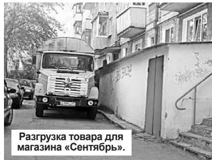
Разгрузка товара для магазина «Сентябрь».