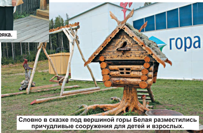
Словно в сказке под вершиной горы Белая разместились причудливые сооружения для детей и взрослых.

вникали, такие как «Кости» для игры в «Бабки», «перочинный нож», «одноклашки». Опытный экскурсовод разъяснила их происхождение. Оказывается, все гениальное, как всегда, просто. Например, дети церковно-приходской школы на свой день рождения приносили горшок каши с маслом, которую ели все по кругу одной ложкой – отсюда и именовали их «одноклашками», дру-