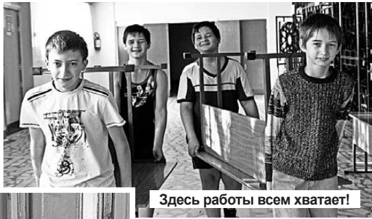
Здесь работы всем хватает!

В общеобразовательных учреждениях Лесного идут последние приготовления к новому учебному году