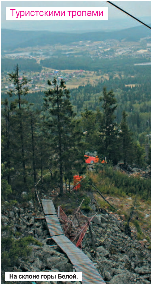
На склоне горы Белой.