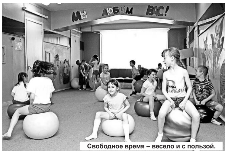
Свободное время – весело и с пользой.

Также мы работаем с беременными женщинами, водим их в бассейн, где с ними занимаются инструкторы. Стараясь охватить курсами реабилитации по всем направлениям, для этого применяем много технологий. В медсанчасти есть