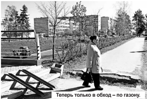
Теперь только в обход – по газону.