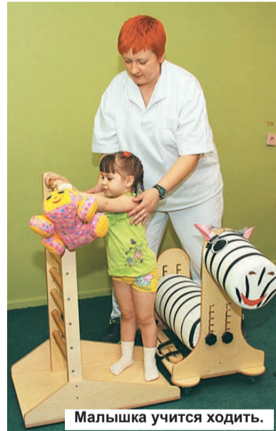
Малышка учится ходить.