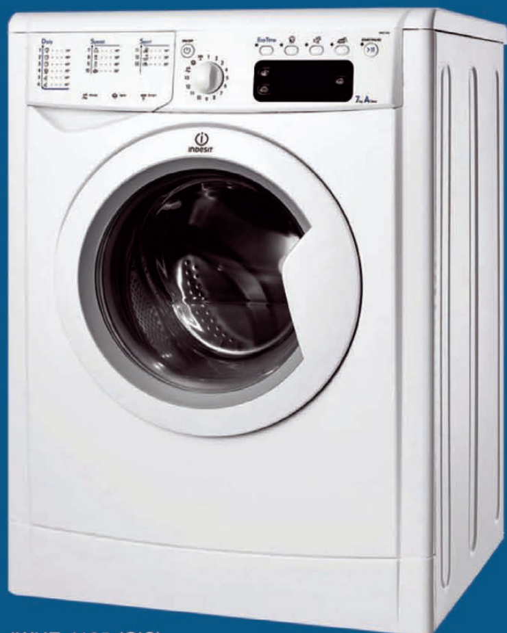
IWUE 4105 (CIS)