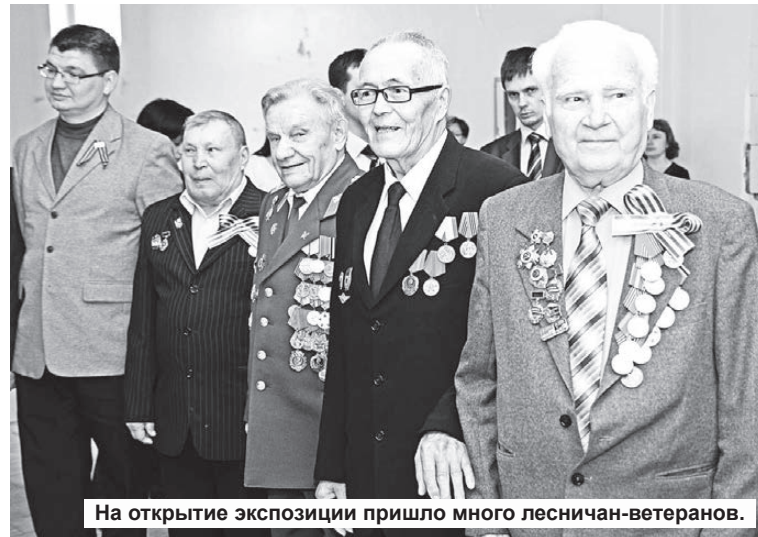
На открытие экспозиции пришло много лесничан-ветеранов.