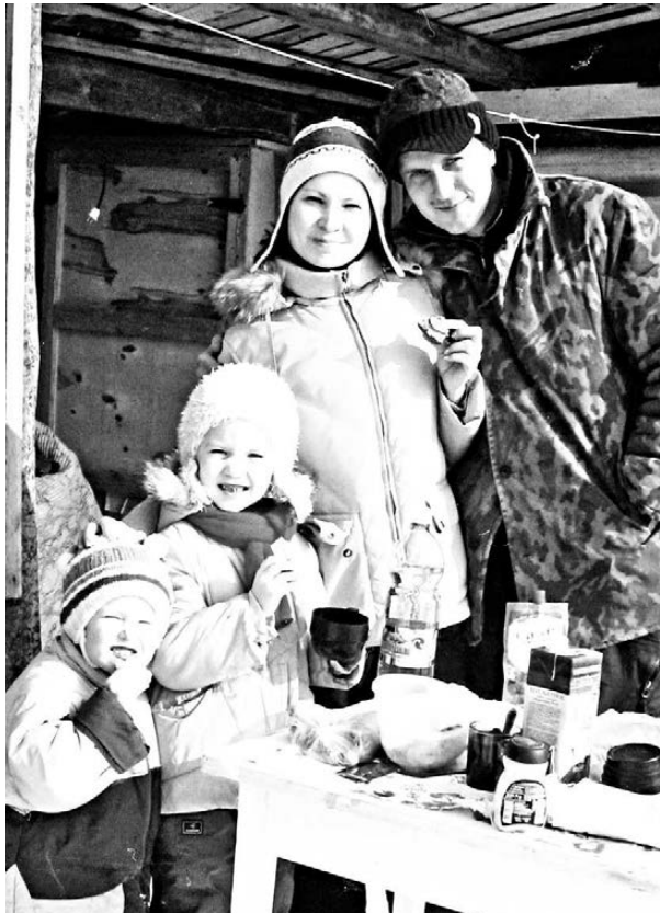
Работаем и отдыхаем вместе

С 1993 года 15 мая отмечается Международный день семьи, учрежденный Генеральной Ассамблеей ООН. Во все времена семья является хранительницей человеческих ценностей, культуры, преемственности поколений, фактором стабильности и развития.