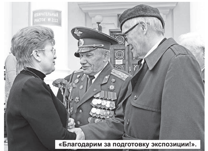
«Благодарим за подготовку экспозиции!».

Хитрин перерезали красную ленту, экспозиция открылась. Место, где разместились экспозиция, наполнили гости. Но среди этой гущи людей были отчетливо видны орден и медали наших ветеранов, сверкающие у них на груди. Ветераны останавливались у стендов и пристально разглядывали портреты наших воинов, прошедших дорогами Великой Отечественной.