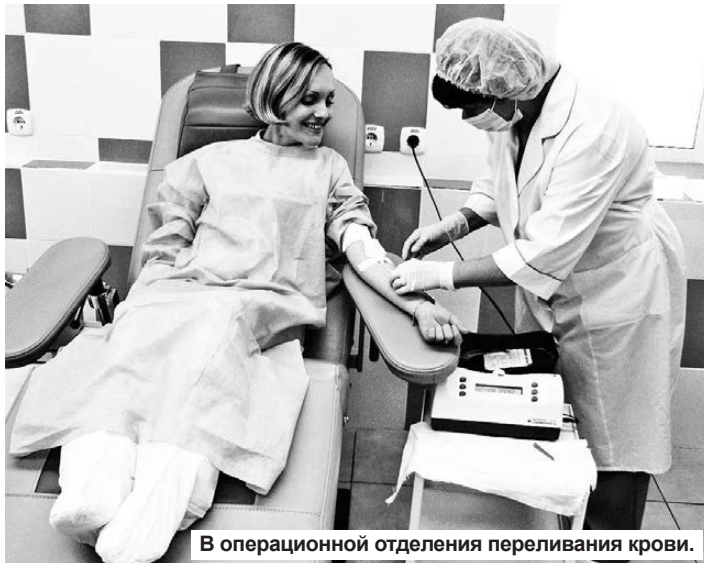
В операционной отделения переливания крови.