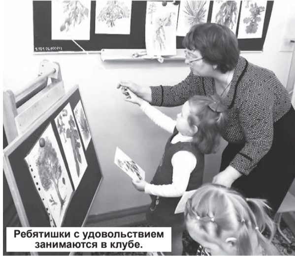
Ребятишки с удовольствием занимаются в клубе.

Познание окружающего мира входит в структуру каждого занятия и содержит сведения о временах года, погодных явлениях, животных, птицах и т.д., на основе которых строятся игры