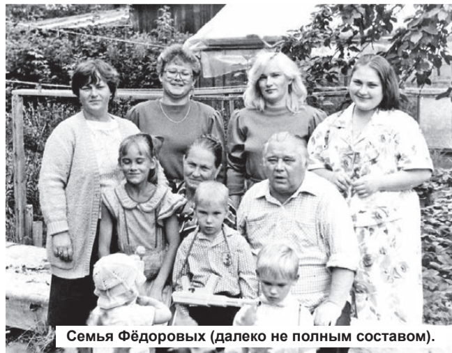
Семья Федоровых (далеко не полным составом).

Наталья АЛЕКСЕЕВА.