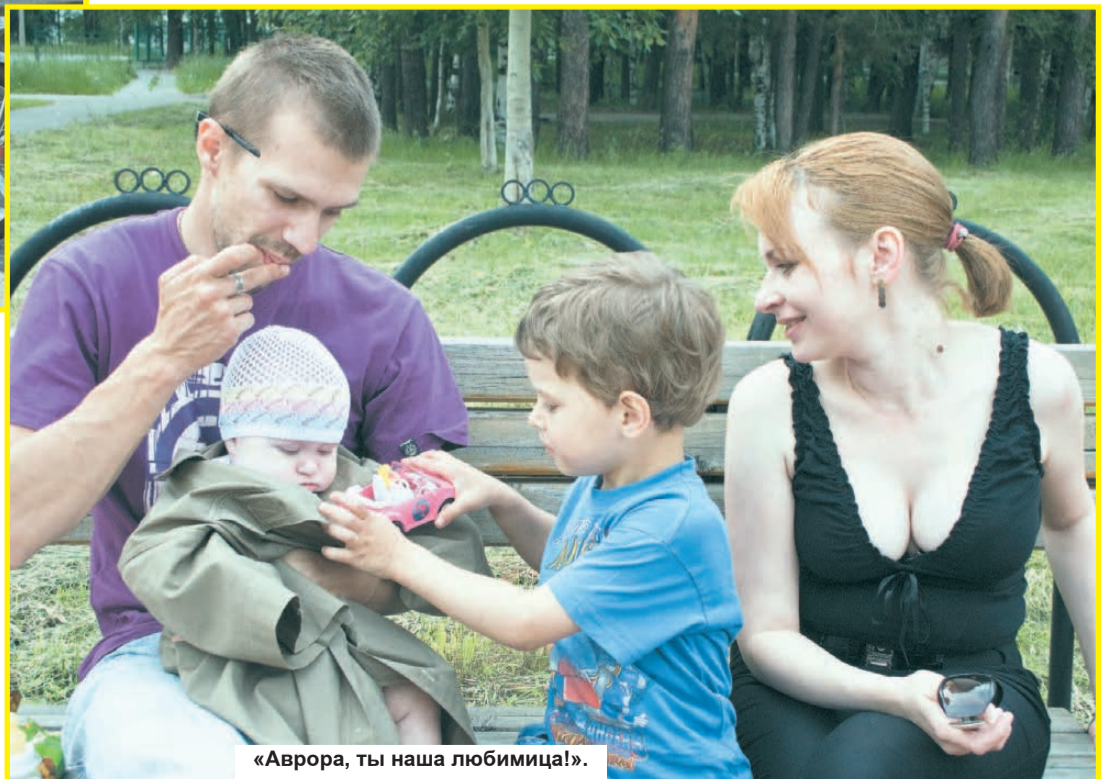
«Аврора, ты наша любимица!».