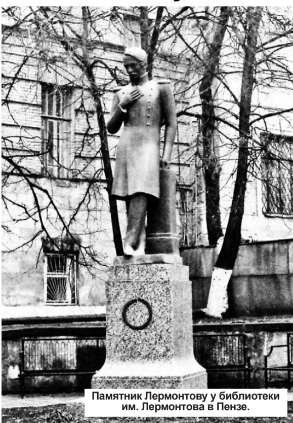
Памятник Лермонтову у библиотеки им. Лермонтова в Пензе.

Интересно то, что во всех помещениях музея нет электричества, и наша экскурсия проходила в немного печальном и таинственном полумраке. Потому, когда усадьбу покидали, ситуация была подобно описанной в стихах.