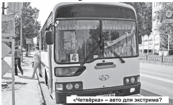
«Четвёрка» — авто для экстрима?

Недавно я решил проехать из поселка Горного в город на маршрутном автобусе № 4. Сел в него около 16.00 и, что называется, — в путь! Пассажирами автобуса были люди разного возраста: и взрослые, в том числе пожилые люди, и дети.