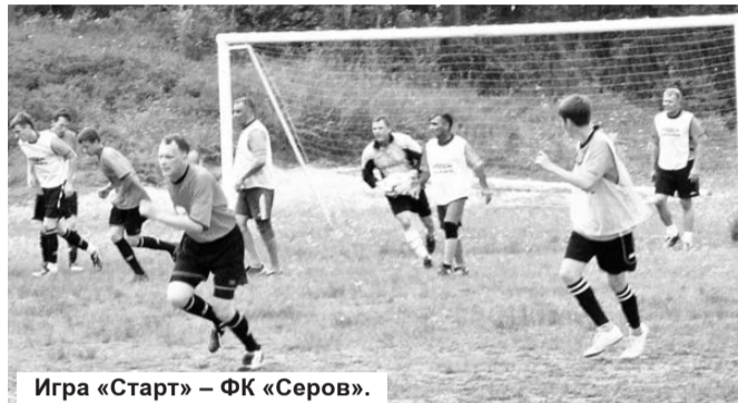
Игра «Старт» — ФК «Серов».