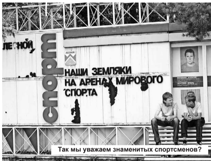
Так мы уважаем знаменитых спортсменов?

Увы, неприглядные картины очень часто можно наблюдать даже недалеко от здания городской администрации. Хлама хватает и вокруг административного здания, взять хотя бы сквер, что на горе вблизи администрации.