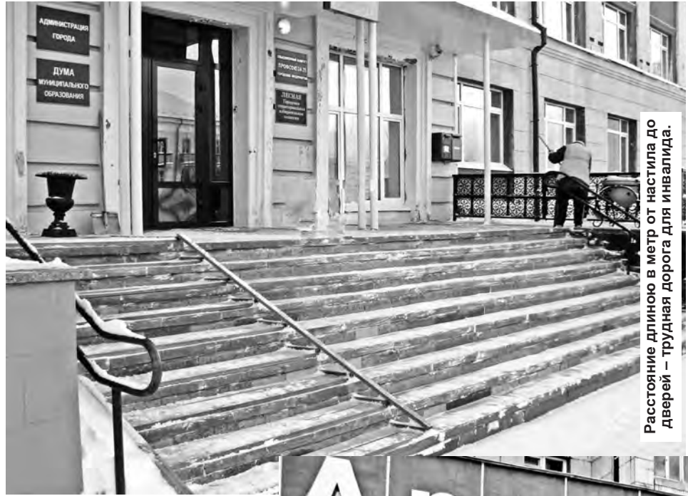
Расстояние длиною в метр от настила до дверей — трудная дорога для инвалида.

делал что-либо подобное. А от пассажиров этого и вовсе не дождешься... В муниципальных же образованиях подобный транспорт практически не закупается. Практика показывает, что серьезные проблемы возникают и в отношении объектов социальной инфраструктуры, введенных в строй до сложившейся системы требований доступности. В СКДЦ «Современник» например, тоже есть настил, в некоторых организациях сделаны пандусы, скаты для въезда колясочников, но это все, что можно предпринять. А во вновь строящихся