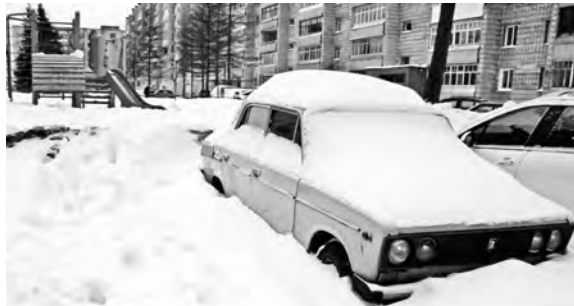
Такую картину можно увидеть в каждом дворе.

Отдельный вопрос и одна из причин, почему плохо убираются улицы и особенно внутриквартальная территория, – машины, припаркованные вдоль дорог и во дворах домов. Как отмечают в ЮККХ, в городе две самые проблемные улицы, заставленные машинами: Кирова, особенно возле магазина «Кировский-Центральный», и Ленина – вниз, до Мира.