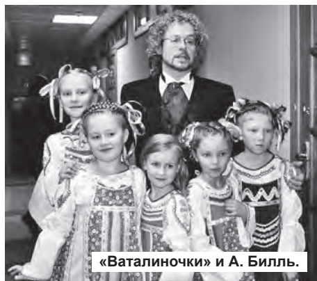
«Ваталиночки» и А. Билль.

«Микс-арт» – это международный фестиваль-конкурс, что проходил на прошлой неделе в Екатеринбурге. В нем принимают участие творческие коллективы, возраст участников которых от 5 до 55 лет! Председателем жюри конкурса является Андрей Билль – заслуженный артист России, арт-директор Московского института современного искусства.