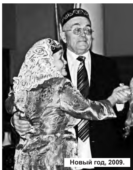
Новый год, 2009.