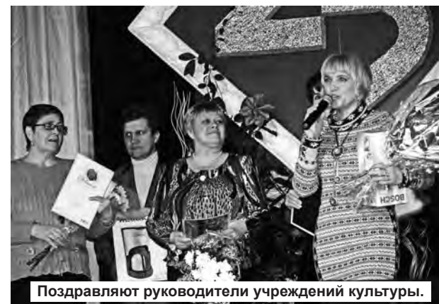
Поздравляют руководители учреждений культуры.