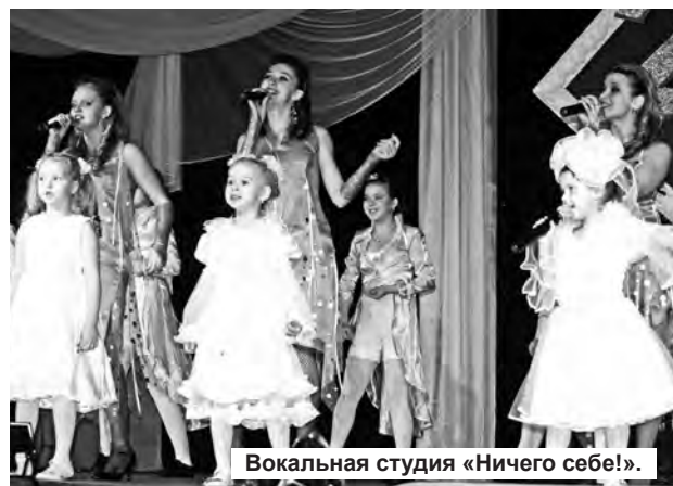
Вокальная студия «Ничего себе!».

А гром уже гремит, потому что начинается третья часть вечера, и на сцене трио «Рио» из Екатеринбурга, но не потому гремят аплодисменты, что гости заезжие. Благодарный зритель своих встречает-