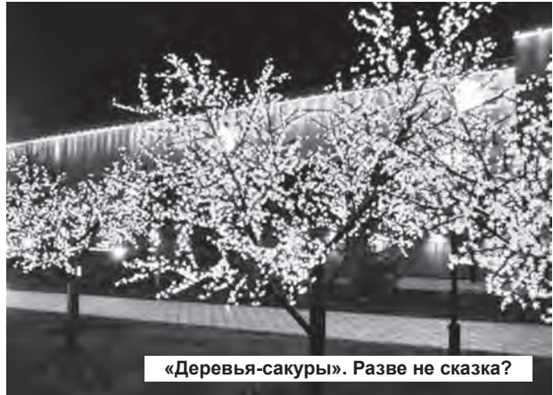
«Деревья-сакуры». Разве не сказка?

– Дорогие коллеги, Дед Мороз и Новый год придут в город 31 декабря, и к этому времени все должно быть готово. Затягивать уже нельзя. Я принимал участие в работе комиссии, поверьте мне на слово, что никакие «излишества» не запланировано. Конечно же, администрация допустила промах в части взаимодействия и информирования депутатов. Это плохо, но в этом не было злого умысла. Если вам кажутся излишними расходы на иллюминацию и подсветку, то это не так: на соседних с площадью домах установят сильные прожекторы, которые сделают площадь действительно яркой и светлой, праздничной. Чтобы там никто и сам лицо не разбил, да и ему не разбили в праздничных сумерках. Кроме