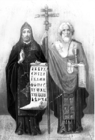
И ум святому просвещала, Она б и сердце очищала.

Кого ты в жены выбираешь?" Девиц Кирилл наш оглядел. И вдруг в лице одной узрел И доброту сердечную, И мудрость бесконечную. Так выбрал он свой путь с Софией, Чтоб Божья благодать отныне