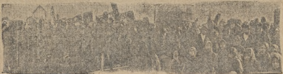
Демонстрация в Октябрьские дни в Реже.

ВОТ КРЕПКАЯ ПОЩЕЧИНА ОПОРТУНИСТАМ ВСЕХ МАСТЕЙ ПОДТВЕРЖДАЮЩАЯ СОТЫЙ РАЗ ПРАВИЛЬНОСТЬ ГЕНЕРАЛЬНОЙ ЛИНИИ ПАРТИИ.