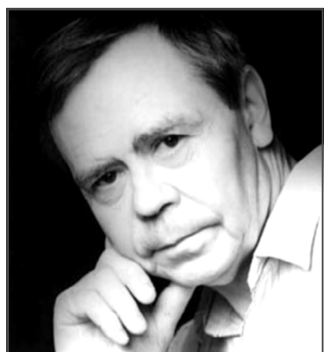
«Горит моё сердце за родную землю...» (В.Распутин)

В 2010 году писатель был выдвинут на соискание Нобелевской премии в области ли-