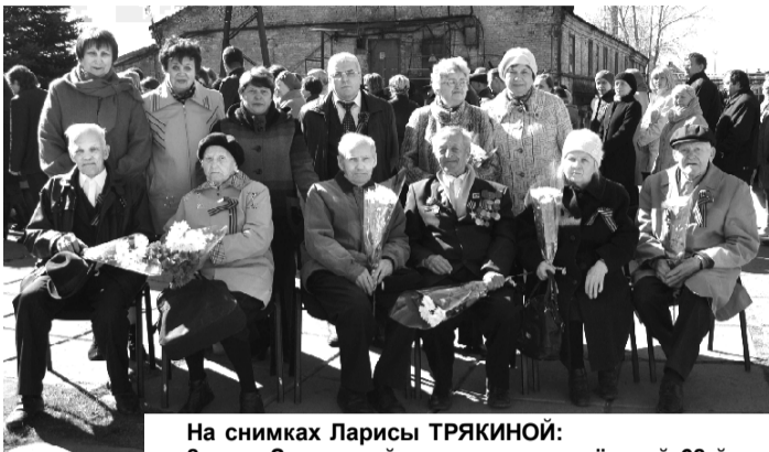
8 мая. Заводской митинг, посвященный 68-й годовщине со Дня Победы нашего народа в Великой Отечественной войне.

В почётном карауле воспитанники кадетской школы-интерната.