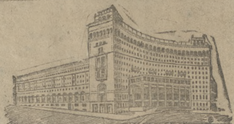
Строится новая Москва. Проект Центрального дома колхозника

На XVII партийном съезде товарищ Куйбышев избирается председателем комиссии Советского контроля. Одновременно он занимает пост первого заместителя председателя Совета Народных Комиссаров и Совета Труда и Оборона СССР.