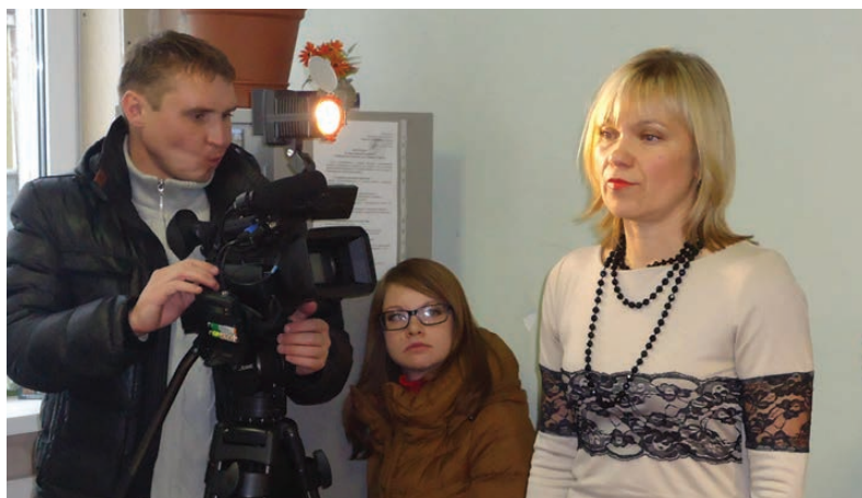
Павел Никифоров

Выслушав мнения сторон, суд принял решение и отказал бывшему директору школы в удовлетворении иска. Ошуркова намерена обжаловать решение в областном суде.