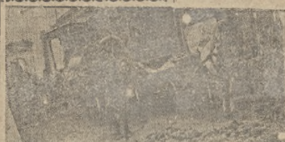
23% хлебозаготовительного плана дают колхозы.