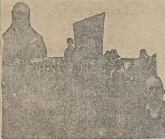
Красный обоз колхозников. Ударники-хлебодачики.

МОСКВА. Возврат ссуд, выданных под контрактацию озимых и яровых посевов этого года в системе хлебной кооперации, проходит плохо. Из выданных 114 миллионов к 20 октября возвращено 44 миллиона рублей.