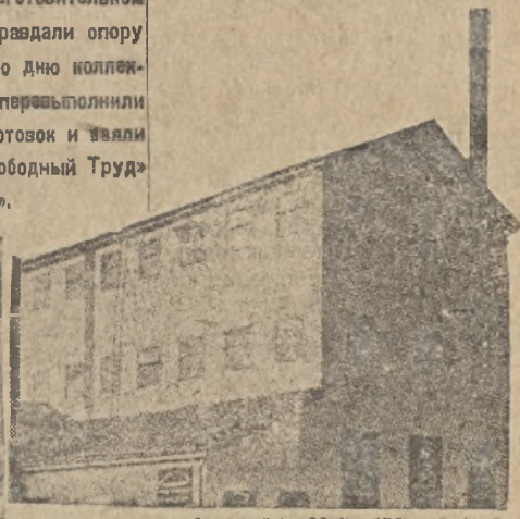
Механизированный сортировочный фронт на «Спартак».

Челябинск, 2 ноября в 6 час., 35 м. К годовщине Октября намечен пуск опытного завода производительностью 100 тракторов в год. Подготовительные работы окончены.