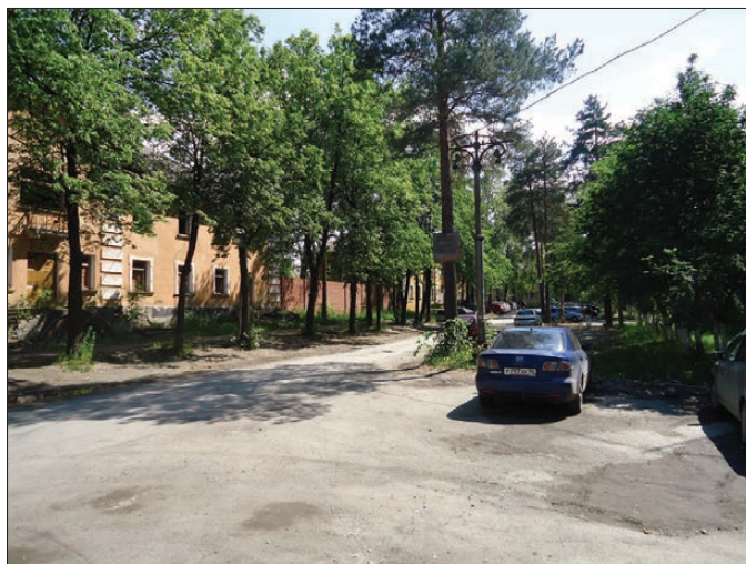
Та же улица сейчас