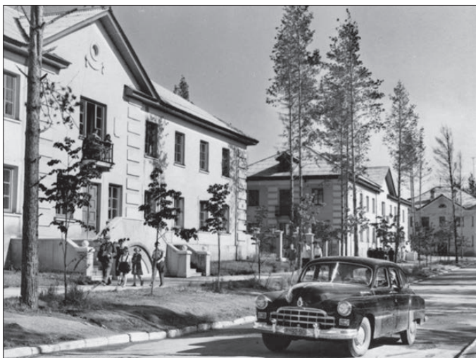
Первоуральск, 60-е годы...

В советское время в книгах о Первоуральске улица Ватутина упоминалась авторами не иначе как утопающая в зелени. Сейчас от былого великолепия остались обрубки. Тополь - дерево ломкое, и кронировать деревья возраста 40-70 лет необходимо, но в Первоуральске, похоже, тополя «пенькуют» - обрезают насмерть, а засохшие стволы рубят под корень. «НеГ» попыталась заглянуть в будущее красивого и зеленого Первоуральска, выяснить, что думают о состоянии городских насаждений сами первоуральцы и какие породы деревьев ходят видеть в городе?