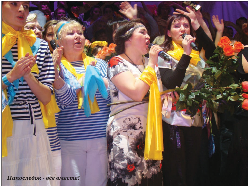
Напоследок - все вместе!