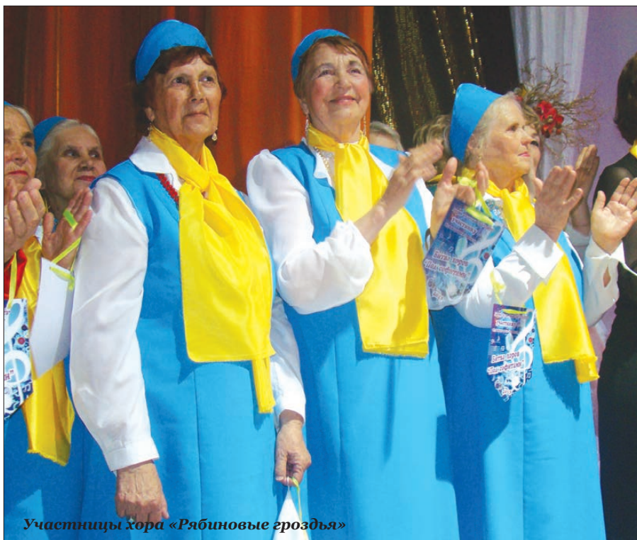
Участницы хора «Рябиновые гроздья»

В программе было 24 конкурсных номера, над которыми в течение трех месяцев работали 12 хормейстеров и 245 лучших голосов города в возрасте от 5 до 82 лет. В состав жюри входил один из участников хора «Виктория» - победителя всероссийского проекта «Битва хоров» на телеканале «Россия».