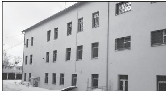
Павел Никифоров Фото автора

По словам полицейских, в апреле в суд будут переданы 15 уголовных дел, возбужденных по статье 158 УК РФ «кража».