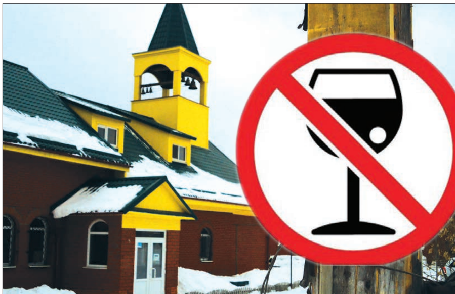
Акафист перед иконой читают в храме каждый понедельник в 17 часов