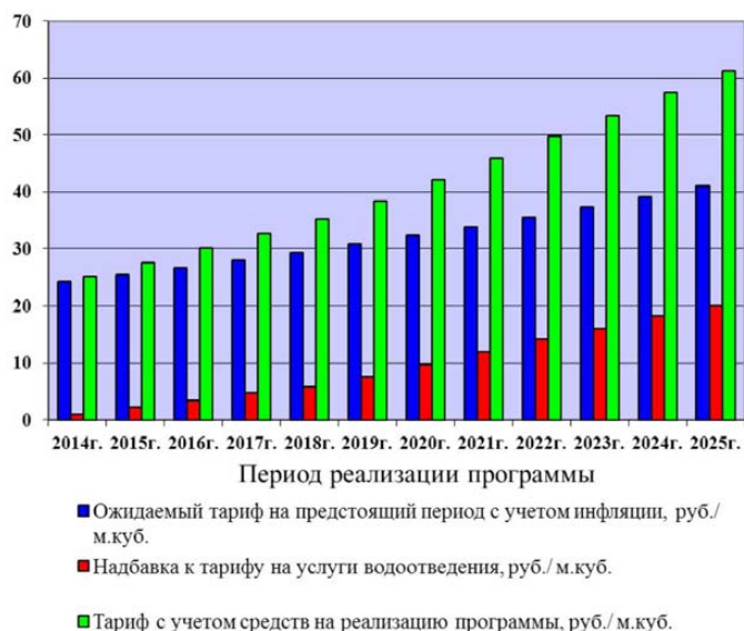
Рисунок 2- Изменение уровня действующих тарифов в результате включения в них средств на реализацию инвестиционной программы

Успешная реализация Инвестиционной программы позволит обеспечить: повышение качества коммунальных услуг; безопасность и комфортность проживания; снижение уровня износа основных фондов коммунального хозяйства.