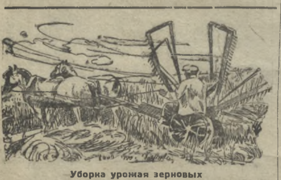
Уборка урожая зерновых

Октябрьская революция разбила старую буржуазную, государственную машину управления и порабощения эксплуатируемых. Власть перешла к пролетариату. Земля, фабрики, заводы, железные дороги и т. д. перешли в собственность рабочего класса и трудящегося крестьянства. Развитие капитализма в деревне был нанесен значительный удар. Сразу же после окончания вооруженной борьбы, коммунистическая партия поставила задачу восстановления, разрушенного шайбством белых и интервенционистских армий, сельского хозяйства и промышленности.