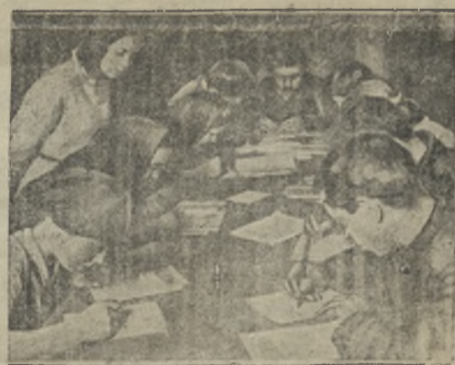
На снимке: Культармеец ведет занятие с группой малограмотных

17 парт конференция дала установку на вторую пятилетку. Надо мобилизовать все силы рабочих, колхозников, бедняцко-средняцкое крестьянство на борьбу за социалистическую культуру, за темпы за нового человека, сознательного члена и борца социалистического хозяйства. 2-я пятилетка будет временем действительного расцвета социалистической культуры.