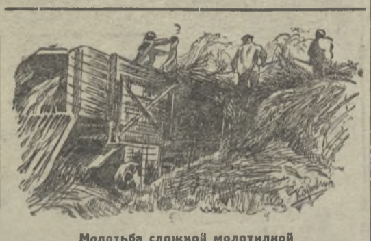
Молотья сложной молотилкой

Цифры характерно доказывают, что сельское хозяйство района к моменту восстановительного периода не только перешагнуло довоенный уровень в части посевных площадей, но и во введении в сельское хозяйство лучших орудий обработки земли и машин.