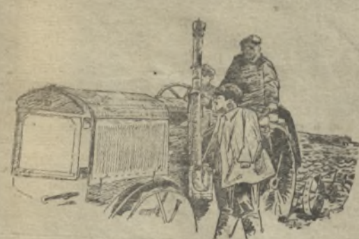
Транктор Режевской МТС

Развитие колхозного строительства приняло массовый характер уже в 1928-29 г., не только по увеличению количества хозяйств, но и по количеству коллективных форм, т. е. переход от низших форм к более высоким формам колхозного строительства. 1931 и 1932 года уже являются годами закрепляющимися колхозы в районе, годами сплошной коллективизации, для чего можно привести следующие цифры.