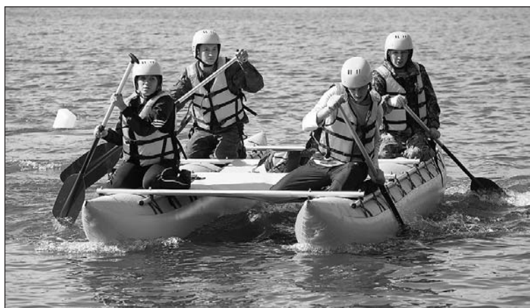
Многие впервые сели за вёсла.