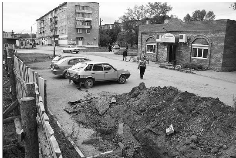
Машины стоят, и работа стоит.

На участке по ул. Новая начались раскопки, работники намерены сломать парковку у магазина «Народный». С чего вдруг, не предложив никакой альтернативы? Магазин продолжает работать и покупателям нужно где-то оставлять свои машины.