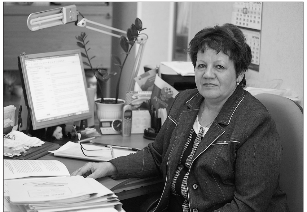
Деньги любят счёт.

В отличие от Контрольно-ревизионной комиссии задачей деятельности специалиста по ревизионной работе Финансового управления, как органа финансового контроля администрации городского округа, является осуществление последующего финансового контроля за операциями с бюджетными средствами на территории городского округа. Следовательно, не в обиду коллегам будет сказано, Финансовое управление занимается констатацией