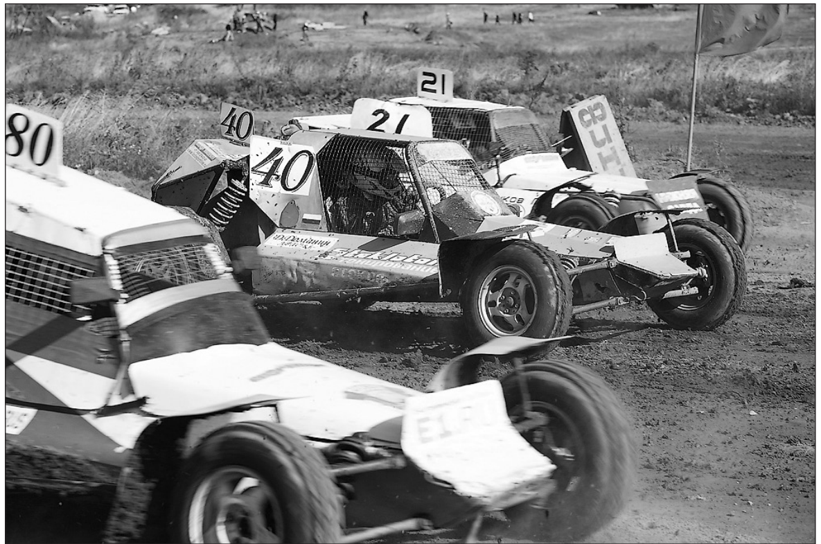
На крутых поворотах вновь машину бросает в кювет...

Посмотреть на живой аналог «Формулы один» приехало больше сотни зрителей. Для них автогонки – невиданное зрелище. Интереснее всего захватывающие