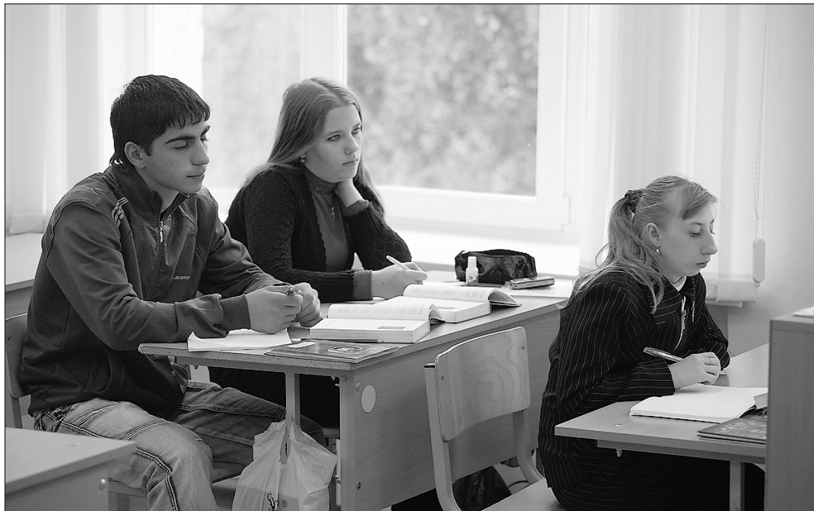
Когда нет одного ученика, значит нет четверти класса.

В следующем году в городе не будет выпускных балов. Все потому, что 11-х классов в салдинских школах нет. Нет почти. В единственном 11 классе школы №7 – четыре ученика.