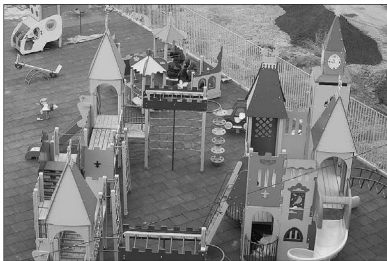
Детский городок возведён.

Фирма «Асфальт-НТ» приступила к разработке земельного участка. Нужно было соблюсти все требования фонда к качеству строительных материалов. Не без проблем и перебоев с поставками шла укладка асфальта