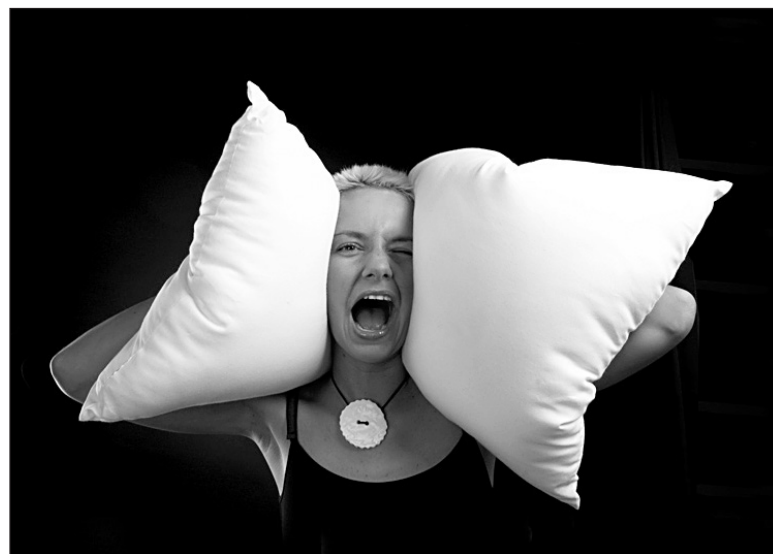
Где искать спасения от шума?