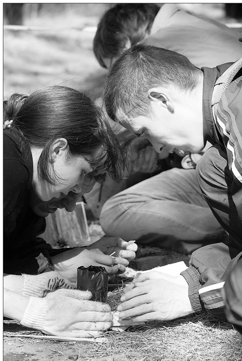
Когда в кружке закипит вода - это сигнал в остановке времени.

Соревнованиям предшествовала большая подготовительная работа. В ней приняли участие профком и ряд подразделений института во главе со своими руководителями: соцбытотдел, группа эстетики, автотранспортный цех, отдел метрологии, общепит, управление снабжения, электроремонтный участок и другие. Большую помощь оказали руководители и сотрудники ОВД, а также опытные туристы других предприятий, которые помогли подготовить трассу и провести судейство на этапах соревнований.