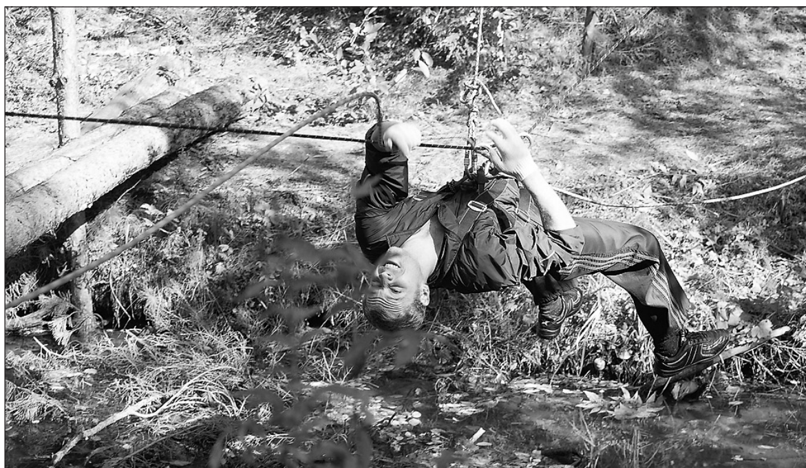
Навесная переправа - берег левый, берег правый.