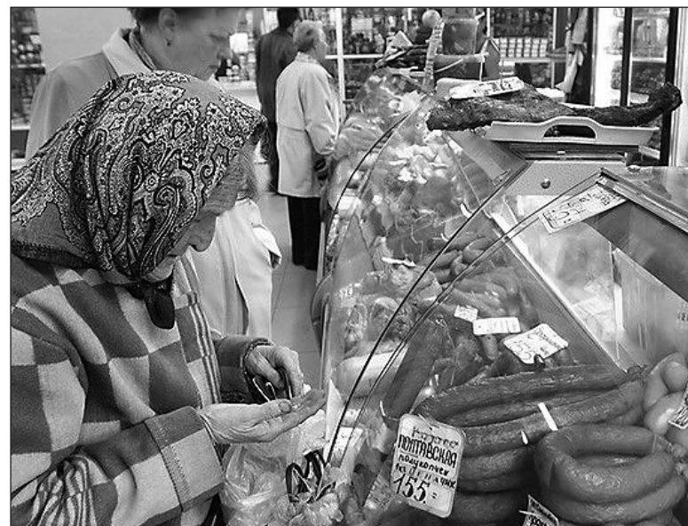
А хватит ли кровных?

Рост цен на гречневую крупу заставил некоторых продавцов и вовсе отказаться от её реализации. Пока цена килограмма в