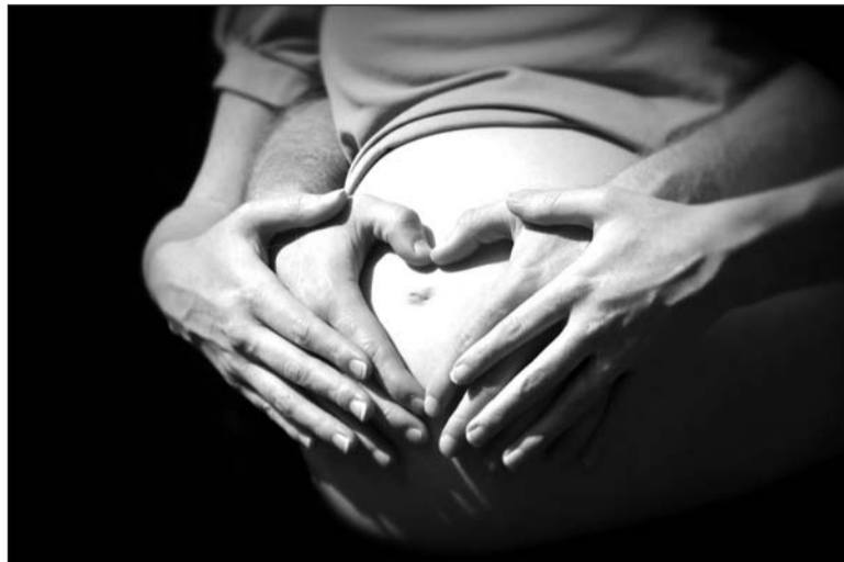
Главное, чтобы рядом был любящий мужчина.

Сведения о количестве рожениц и женщин, прерывающих беременность, будут уходить