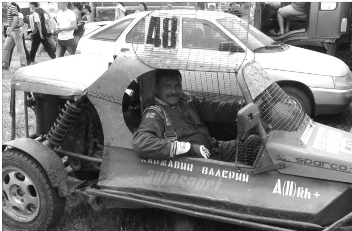
Гонки? Только на специальных трассах!

Салдинские гонщики готовятся завоевать кубок России по автокроссу в День физкультурника.