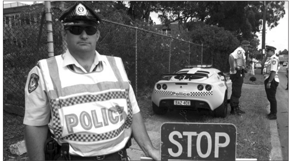
Айн, цвайн, и уже полицай!

Претерпят изменения и принципы применения сотрудниками правоохранительных органов физической силы. Будет запрещено наносить человеку удары резиновой дубинкой по голове, шее и ключичной области, животу и другим жизненно-важным частям тела, применять наручники, если они влекут телесные повреждения и применять водомёты при температуре ниже нуля градусов. Запретят также полицейским прибегать к пыткам и пытаться оправдывать нарушения чьих-либо прав служебными интересами. Впрочем, вместо этого даётся право свободно применять табельное огнестрельное оружие для задержания лица,