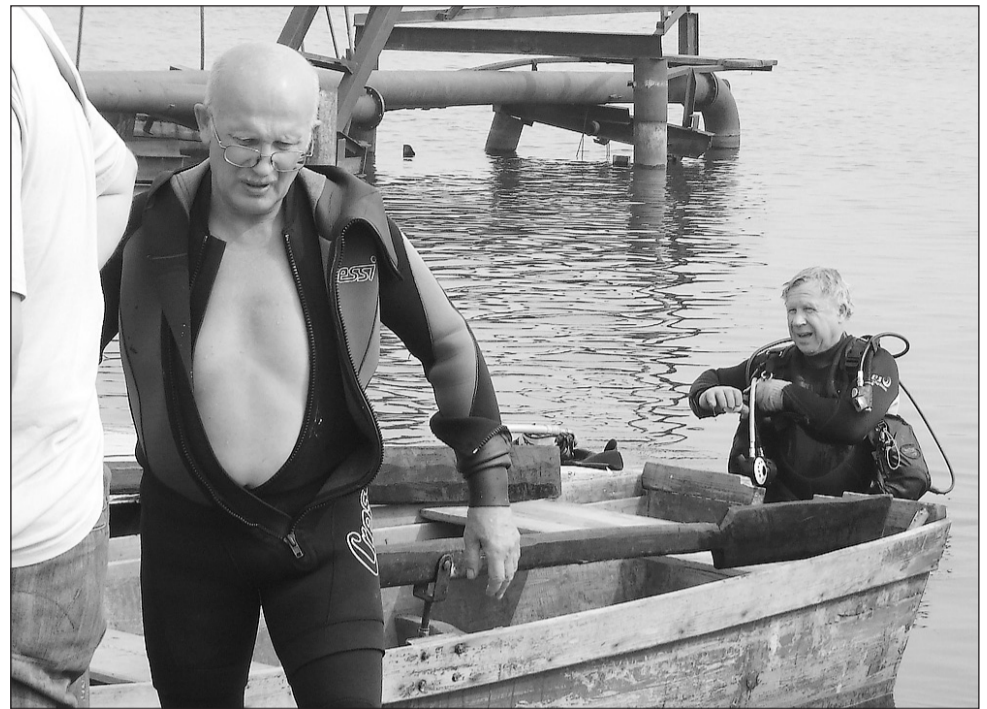
Водолазам потребовалось полчаса, чтобы обнаружить тело.

Оба утонувших, по предварительным данным милиции, были в состоянии алкогольного опьянения. Что послужило причиной смерти – судороги, сердечный