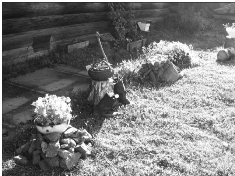
И жизнь расцветает!

Август – самое цветущее время года. «Вестник» совместно с отделом «Садовод» объявляет о начале нового конкурса «Клумба года». Если вам есть чем гордиться, звоните! И ваш цветник увидит весь город! Главный приз – сертификат на 2000 руб. от отдела «Садовод», расположенного в магазине «Волна».