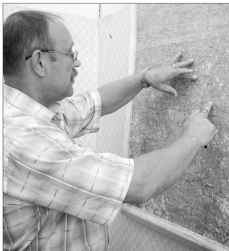
Огонь не придёт с севера. Его могут развести только люди.

Сегодня нашим пожарным, даже тем, кто на выходном, запрещено уезжать дальше Верхней Салды и рекомендовано быть всегда на связи. Лесникам предложили организовать контрольно-пропускные пункты на въездах в лес, провести профилактические беседы с охотниками и рыболова-