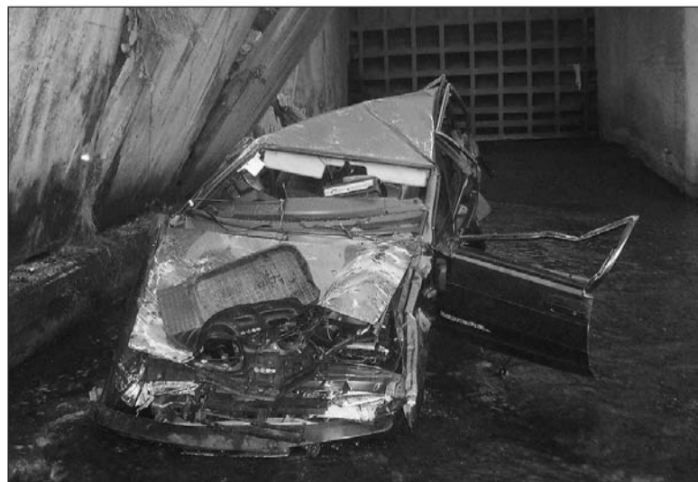
«Девятка» превратилась в груды железа.

Ранним утром 7 августа в дежурную часть поступило сообщение, что в канале плотины Верхней Салды обнаружена вазовская «девятка».