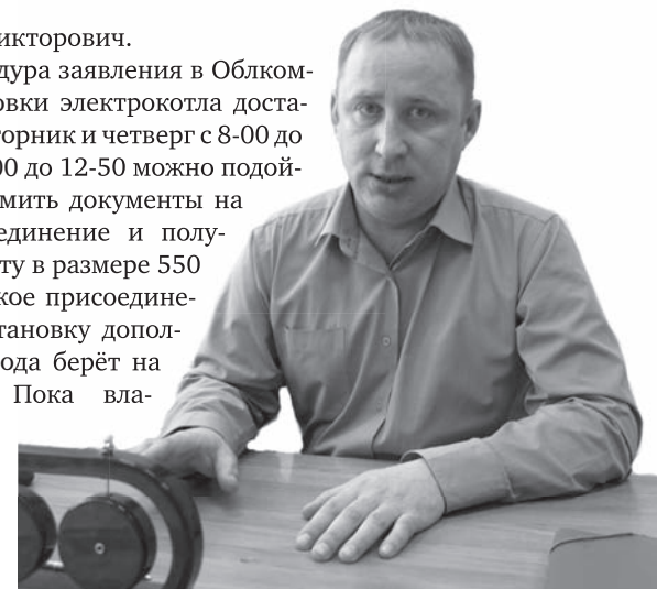
Свои проблемы потребители могут решить сами

Действительно, процедура заявления в Облкоммунэнерго факта установки электродкотла достаточно проста. Каждый вторник и четверг с 8-00 до 17-00 с перерывом с 12-00 до 12-50 можно подойти в кабинет № 4 оформить документы на технологическое присоединение и получить квитанцию на оплату в размере 550 рублей за технологическое присоединение. Все расходы на установку дополнительных опор и провода берёт на себя Облкоммунэнерго. Пока владельцы мощных электроприборов не выйдут из «тени», остальным так и придётся каждый день вызывать электромонтеров и ждать их во тьме.