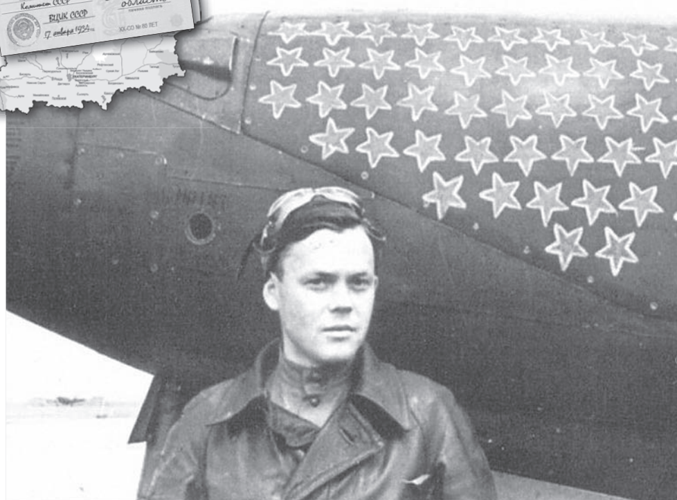
Рекорд уральца Г.А.Речкалова на американском истребителе Bell P-39 Airacobra в годы Великой Отечественной войны так никто и не побил. Воздушный ас совершил 450 боевых вылетов, провёл 122 воздушных боя, сбил 61 самолёт противника.