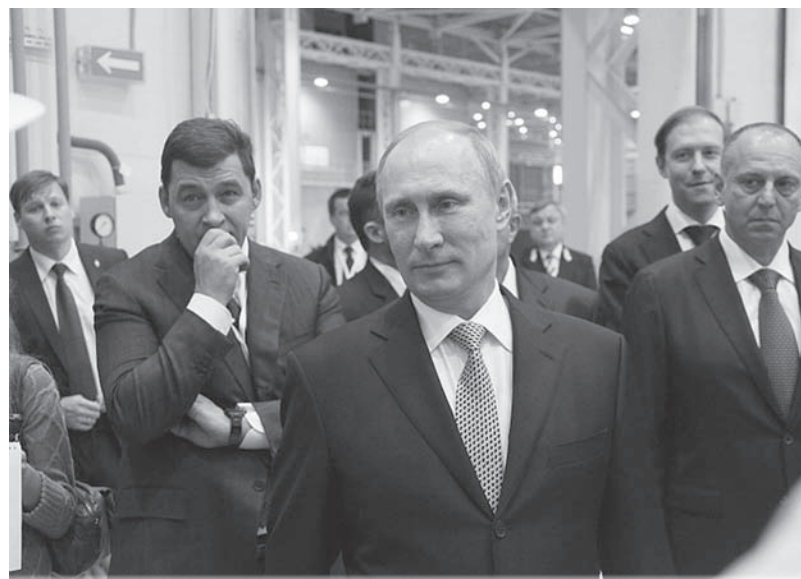
Президент Владимир Путин в сопровождении губернатора Евгения Куйвашева в завершение визита в Свердловскую область 11 ноября посетил завод «Уральские локомотивы» в Верхней Пышме, где в этот день был дан старт производству скоростных электропоездов «Ласточка».

Накануне финального марафона за право проведения «ЭКСПО 2020», на которое также претендуют Дубай (ОАЭ), Измир (Турция) и Сан-Паулу (Бразилия), главы двух государств Владимир Путин и Нурсултан Назарбаев дали высокую оценку Екатеринбургу в ходе X Межрегионального форума сотрудничества России и Казахстана.