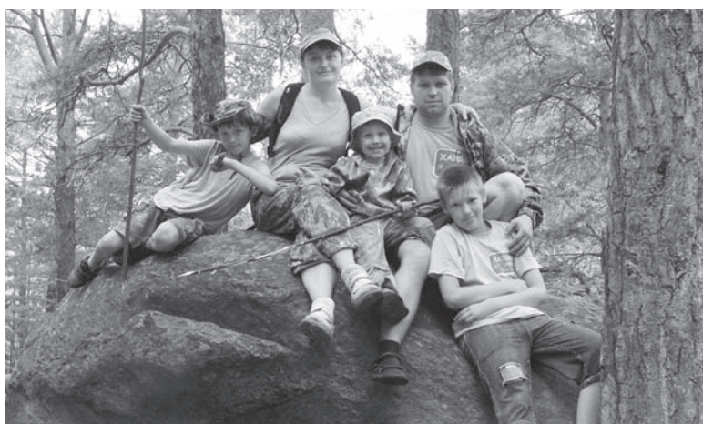
С такой командой - хоть на север, хоть на юг

– О том, что это «мой» ребёнок, я поняла сразу, только за-