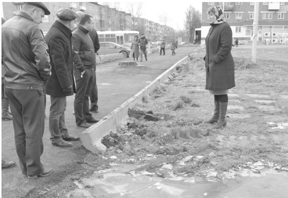
Две стороны, а дело общее