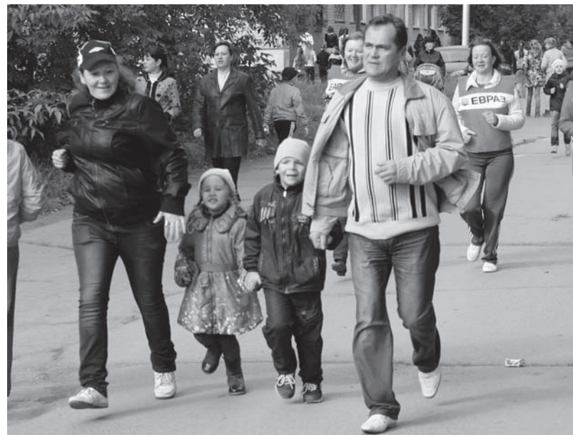
Мама, папа, я - спортивная семья