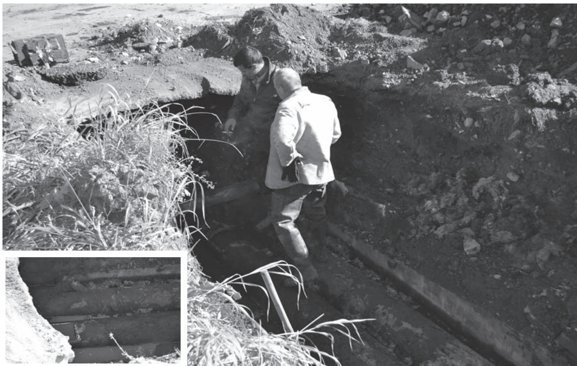
Ржавые трубы - холодная зима

Салдинцы, которые были вынуждены объезжать 19 сентября перекрёсток на Ломоносова-Фрунзе, звонили в редакцию: «Почему ремонт начался только спустя несколько дней после аварии?»