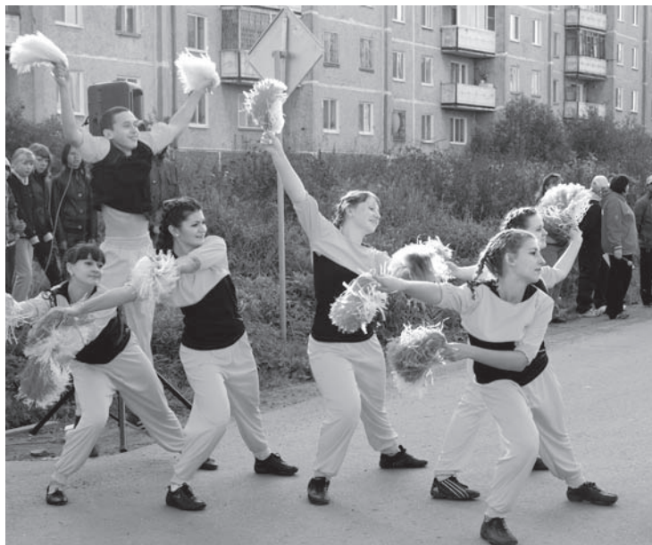
Праздничный старт - удачный финиш