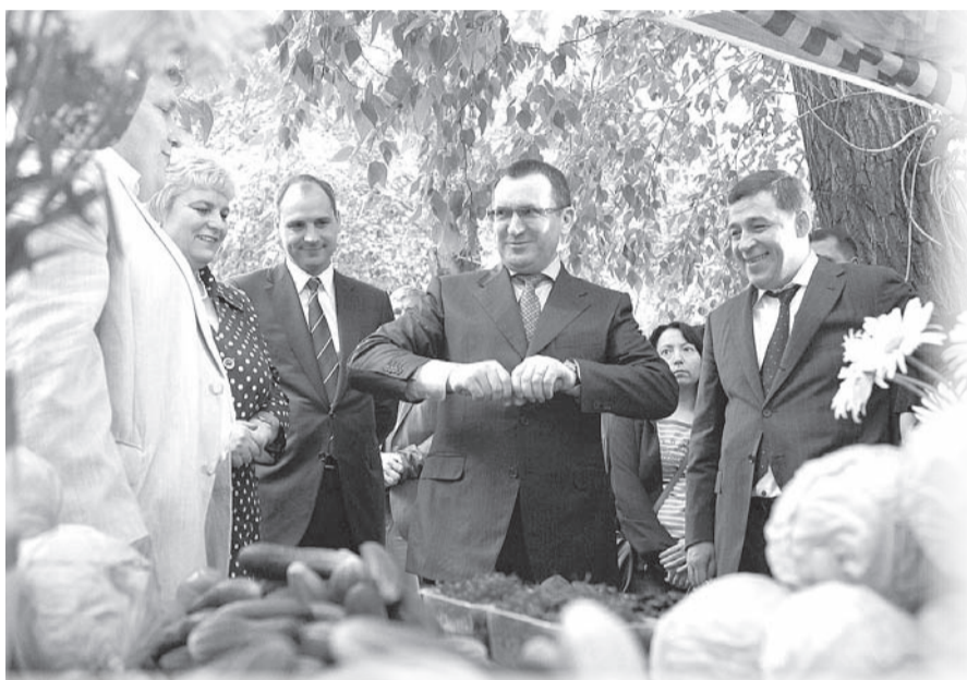
Губернатор Евгений Куйвашев и министр сельского хозяйства РФ Николай Фёдоров посетили Уральский аграрный университет в Екатеринбурге

Свердловская область может рассчитывать на федеральные субсидии для обновления парка сельхозтехники, которые будут выделены регионам в ближайшее время. Об этом заявил министр сельского хозяйства РФ Николай Фёдоров во время рабочей поездки на Средний Урал.