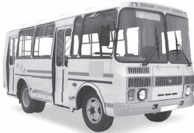
Расписание движения автобуса по маршруту 3 в рабочие дни

Этой красотой, в которую вложена частичка души наших мастеров и мастериц, можно насладиться, придя к нам на выставку.