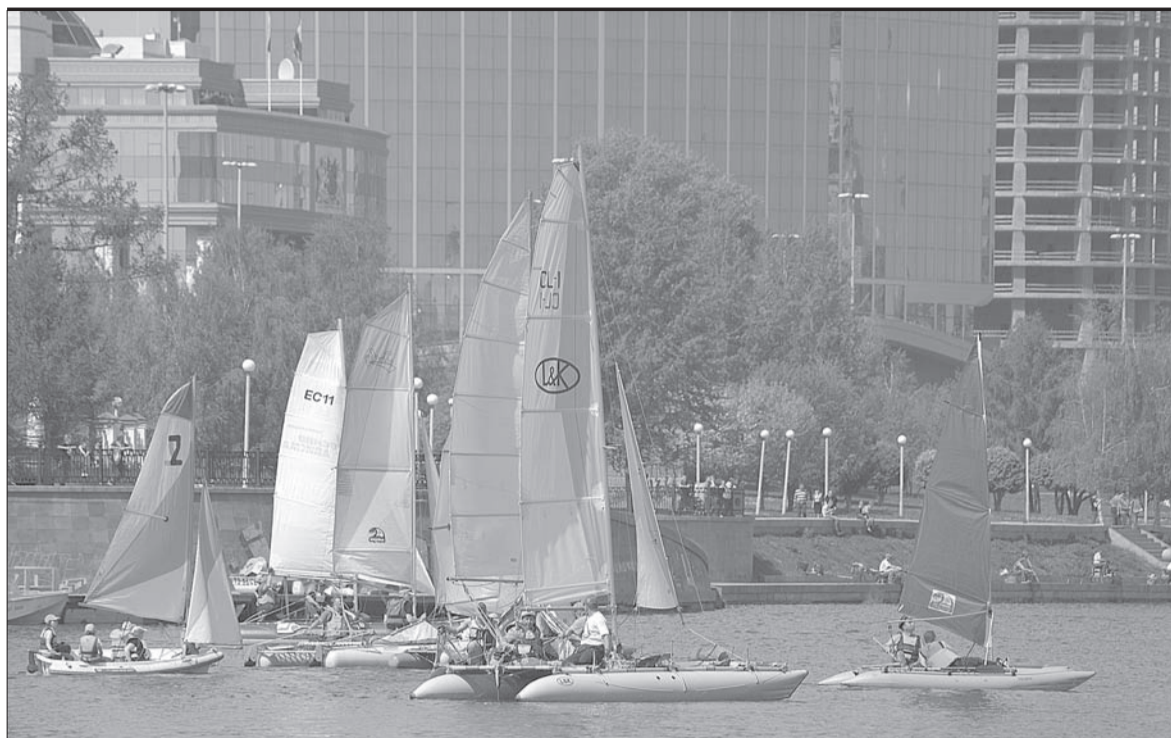
Зеркало Верх-Исетского пруда разрезают яхты и катамараны.