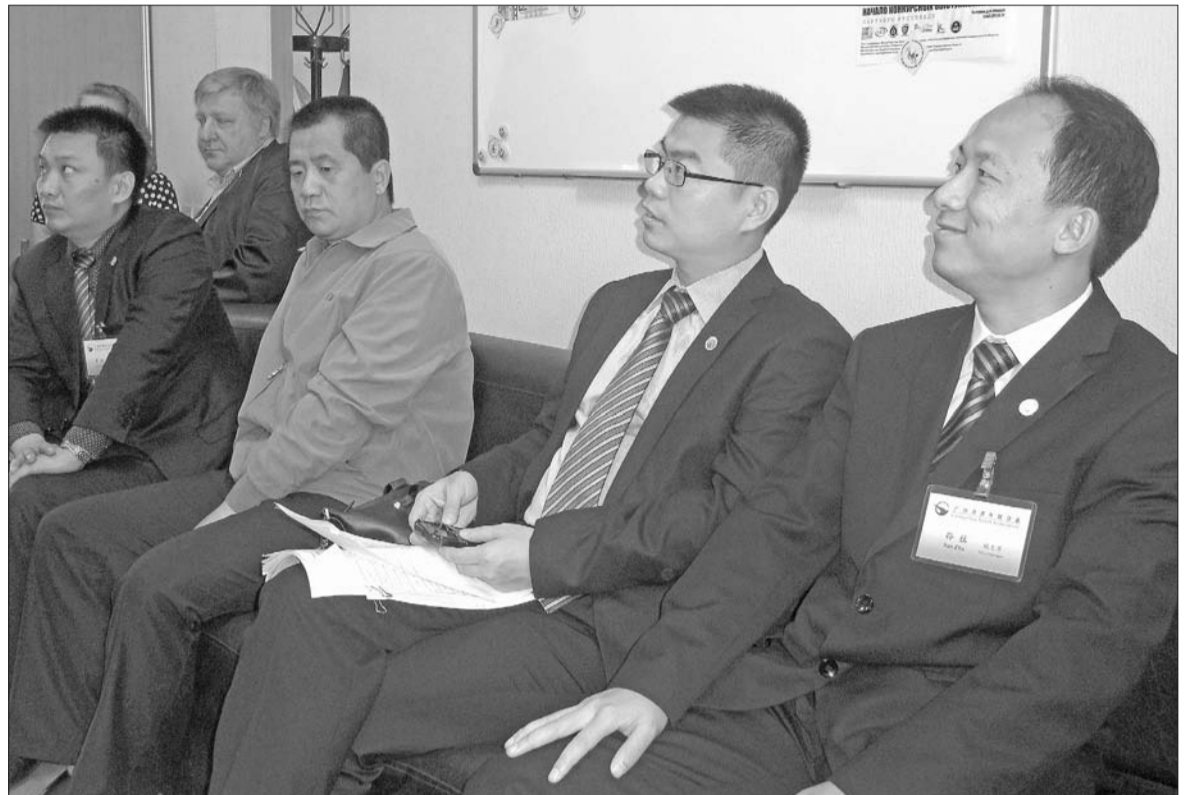
Китайцам в России понравилось, но молодёжь у них поддерживают лучше.

Не будет лишних слов. Организаторы предлагают всем желающим в столь ранний утренний час подойти к мемориалу на пл. Свободы, по примеру одного из организаторов взять свечу, (свечи подготовлены) зажечь, отойти и склонить голову. Время продолжения безмолвной акции – 5-10 минут. Наличие гвоздик не обязательно, но приветствуется. По задумке, цветы возлагать нужно перед зажиганием свечи.