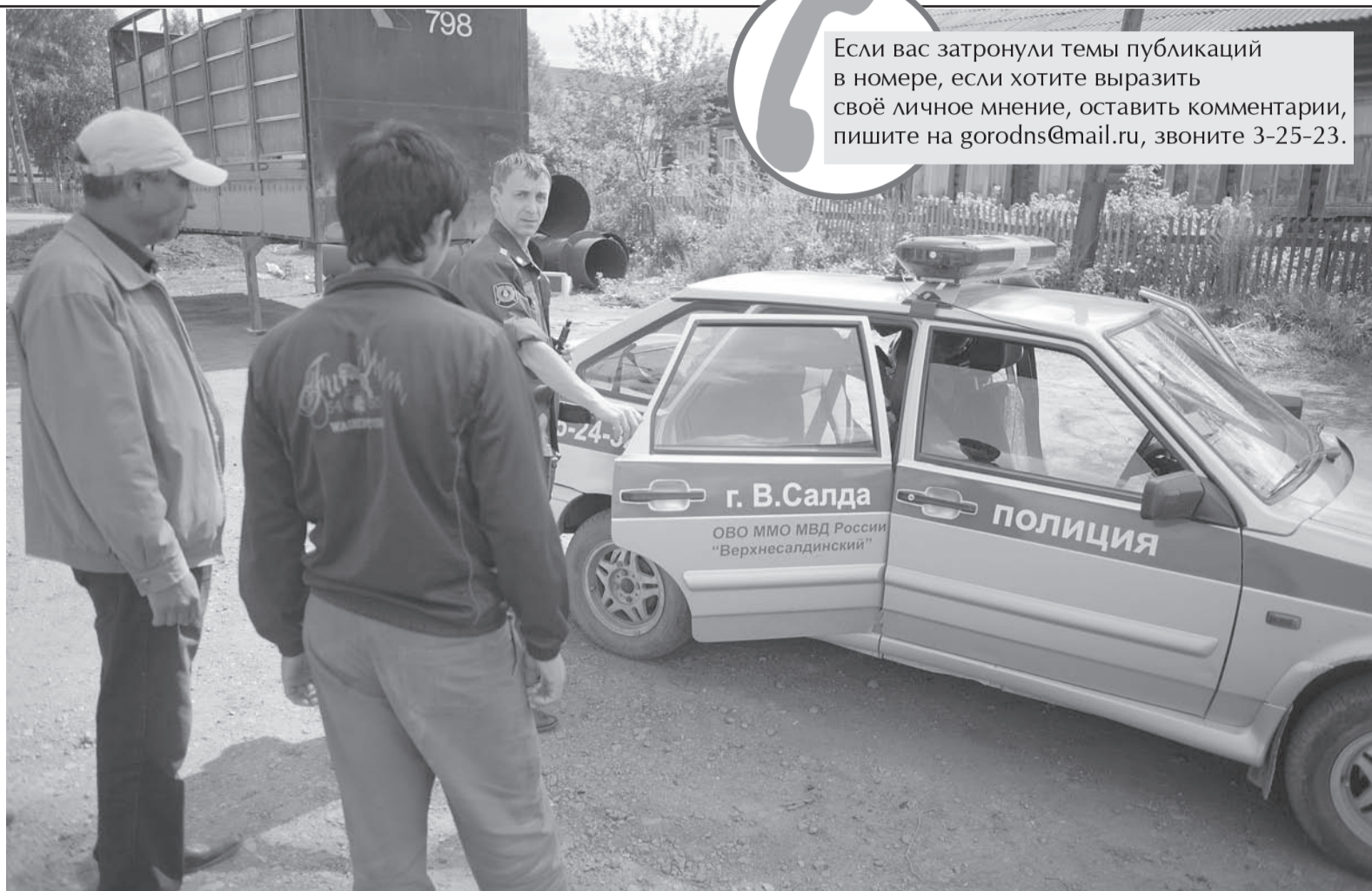
Трудовая армия наступает.

$3 млрд 595,2 млн – объём денежных переводов физических лиц в Таджикистан в 2012 году. Это почти 48% прошлогоднего ВВП республики.