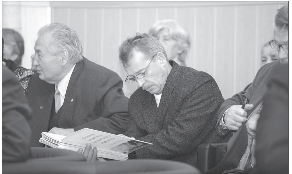
Ветеранские организации – самые активные.