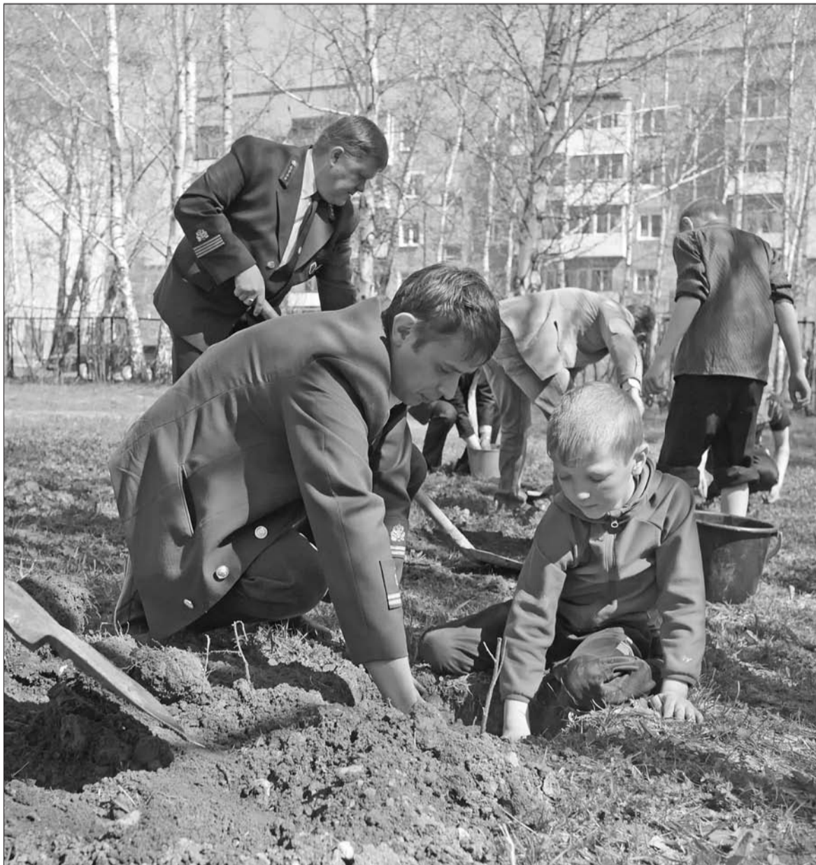
Здесь вырастет детский сад.