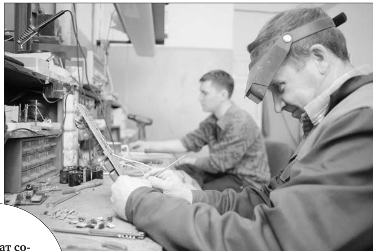
Без проверки плата не попадёт на сборку.

– Раньше в школах были специальные кружки для увлечённых детей, которым нравилось собирать схемы, паять, а сейчас, к сожалению, молодых людей, увлечённых радиоэлектроникой, очень мало, – рассказывает салдинец, директор предприятия