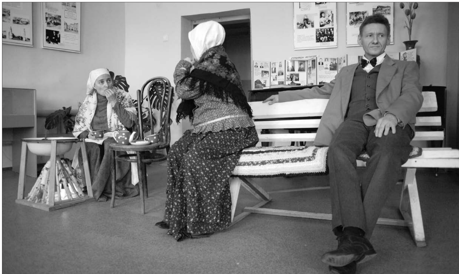
Сцена из спектакля «Золотопромышленники»