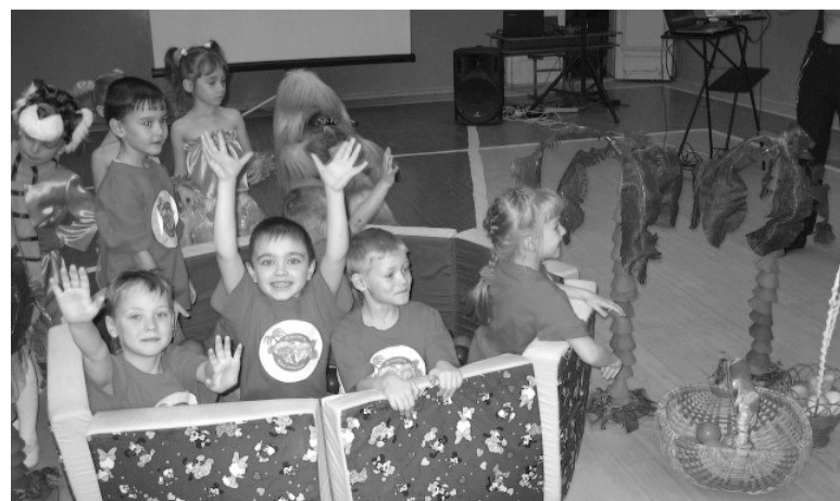
Вначале бассейн был полон фруктов.

Дети преодолевали переправу в джунглях, скакали верхом между кактусами, доставали из бассейна фрукты, показывая свою ловкость. Но главное – почувствовали дух соревнований, умение действовать в команде. Праздник состоялся, победила, традиционно, дружба. Забавные негритята команды-хозяйки пригласили всех в общий спортивный танец, а затем вручили участникам праздника гроздь бананов.