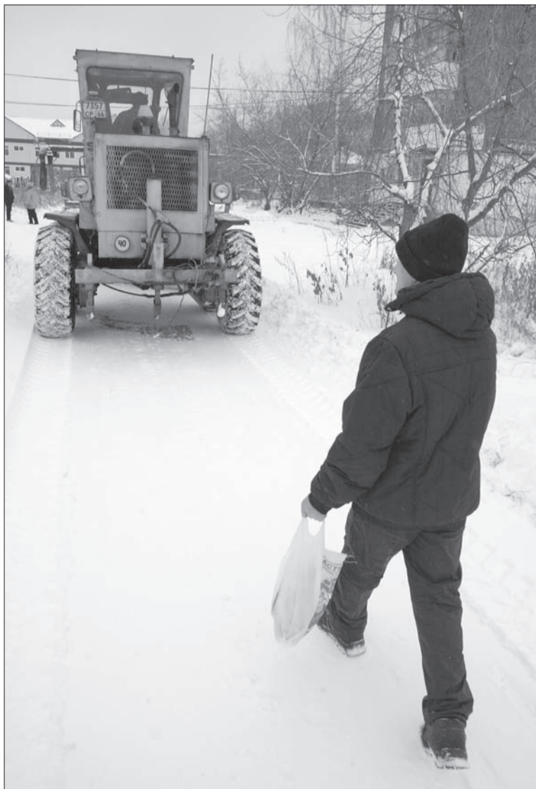
Пускай чистят трактористы чисто-чисто.

– Он и ехал-то почти на тормозах, километров 10 в час, но на спуске в Верхнюю Салду автобус юзом потащило на тормозах, – с дрожью вспоминает попутчица