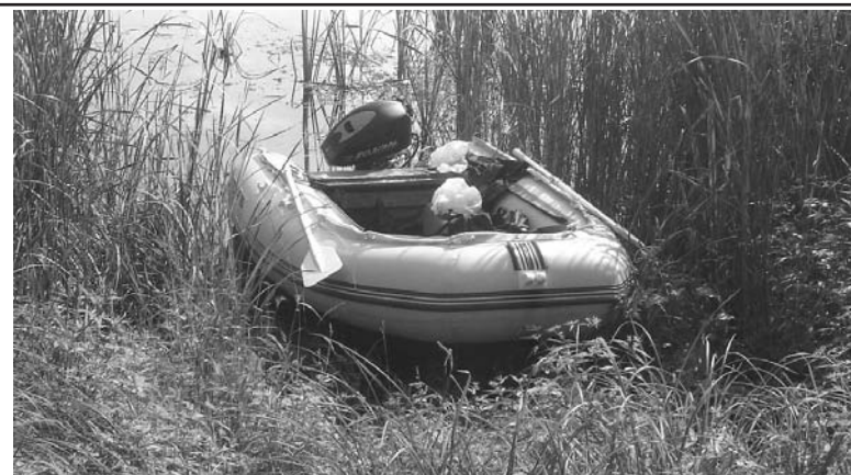
Уплыла лодочка в ночи.

и продуктов на 3 тысячи рублей. Правоохранители, сопоставив показания всех продавцов, задержали гастролёра уже через 3 часа. В Салде Тагил не рулит. Мужчина, как оказалось, ранее судим, совсем недавно подобные преступления совершил в Невьянске.