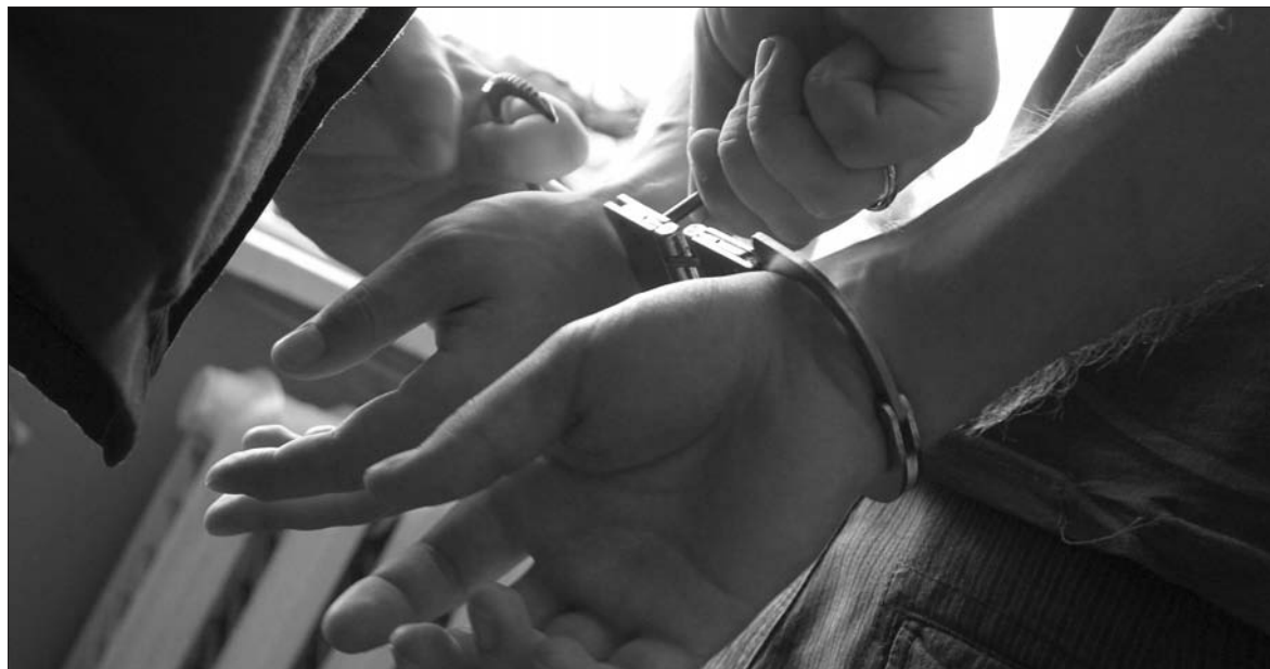
Гастролёров быстро задержали.

Субботним утром, 20 октября, тагильчанин решил запастись бесплатной провизией в салдинских магазинах. Внимание продавцов помогло сотрудникам полиции задержать любителя дармовщинки в тот же день.