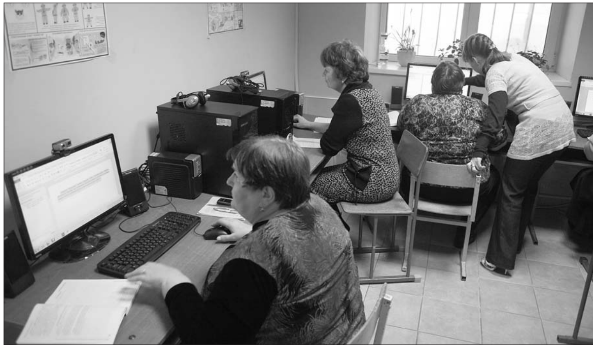
Компьютерный класс – гордость центра.

– Помню, как получали помещение, которое досталось нам