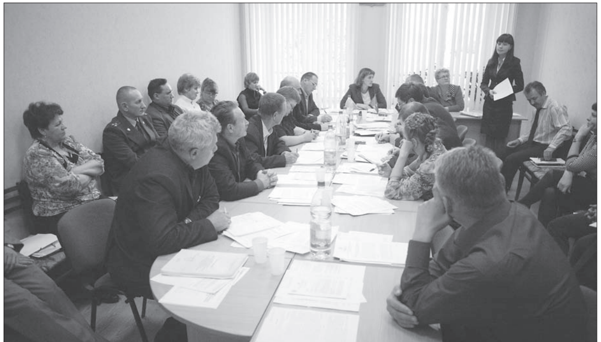
Депутаты, заслушав разные мнения, в итоге решили создать совместную комиссию.

Администрация города привела аргументы в пользу своих расчётов и предложила ком-