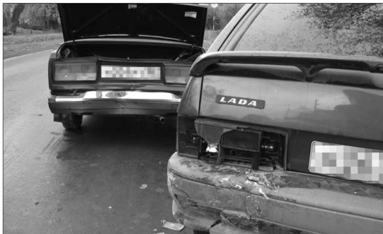
Действующими до окончания указанного срока являются только полисы ОСАГО, выданные «Тирусом» до 11 июля 2012 года. Остальные не имеют юридической силы.