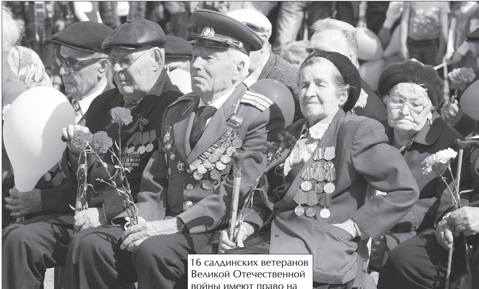
16 салдинских ветеранов Великой Отечественной войны имеют право на получение пособия на ремонт жилья.

Первый салдинский ветеран Великой Отечественной войны воспользовался правом на единовременное пособие в 100 тысяч рублей на ремонт своего жилья.