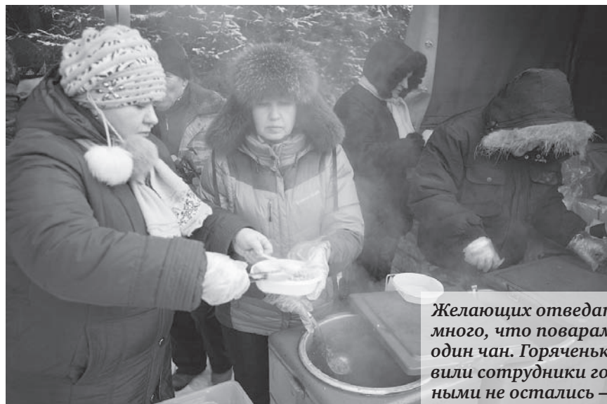
Желающих отведать гречневой каши настолько много, что поварам КШП пришлось готовить ещё один чан. Горяченьким угощение на площадку доставили сотрудники городской пожарной части. Голодными не остались – выдано почти 500 порций.

Во всех случаях второй участник происшествия с места скрылся. Кроме как по свидетельству очевидцев, найти виновников ДТП не представляется возможным, поэтому полицейские обращаются к возможным свидетелям данных происшествий. К тем, кто располагает какой-либо информацией, просьба позвонить по телефонам ГИБДД: 2-46-61,5-01-14.