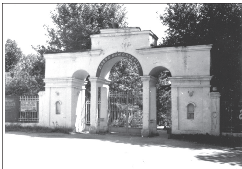
Парк Металлургов, 1978 г.