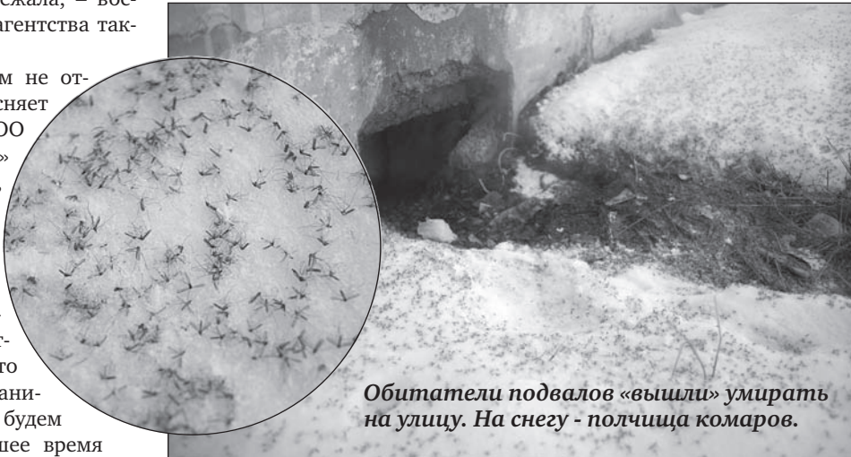
Обитатели подвалов «вышли» умирать на улицу. На снегу - полчища комаров.

Администрация города приложила все силы, чтобы «бесхозные» дома обрели владельцев. В их числе и злополучный дом по Фрунзе. С 1 марта ОАО «Областная жилищная управляющая компания» приступит к работе. Надеемся, в этот раз жильцам повезёт.