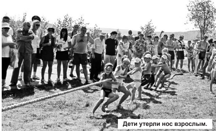
Дети утерли нос взрослым.