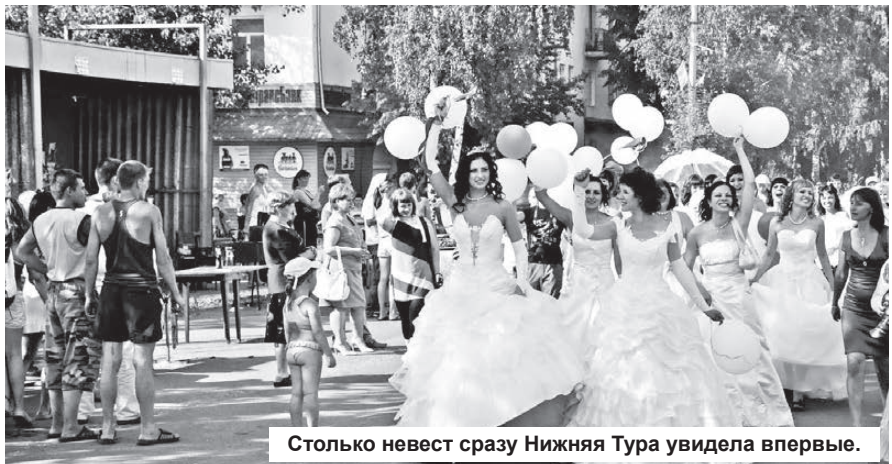
Столько невест сразу Нижняя Тура увидела впервые.

Андрей ПОСТОВАЛОВ.