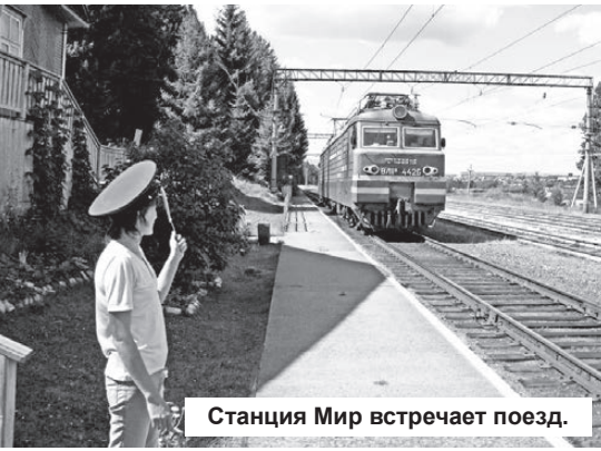
Станция Мир встречает поезд.

Нижнетуринская железнодорожная ветка обеспечивает пригородное сообщение, и жизнь без железной дороги даже в такой провинции, как наша, представить невозможно. Как доказательство подобного утверждения количество билетов на поезд, проданное только в июне этого года: 2890 билетов дальнего сообщения и 990 – пригородного. Понятно, что наплыв объясняется летним сезоном. Однако степень ответственности в работе железнодорожников такова, что если что-то не работает больше часа, то на устранение отказов немедленно выезжает вышестоящее руководство.