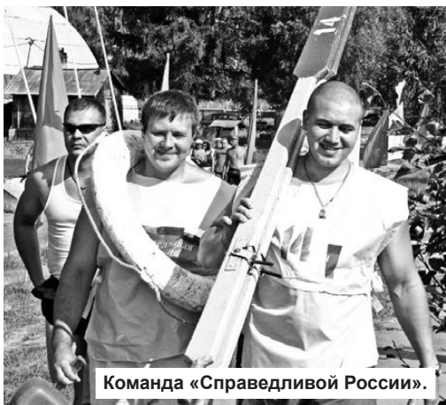
Команда «Справедливой России».