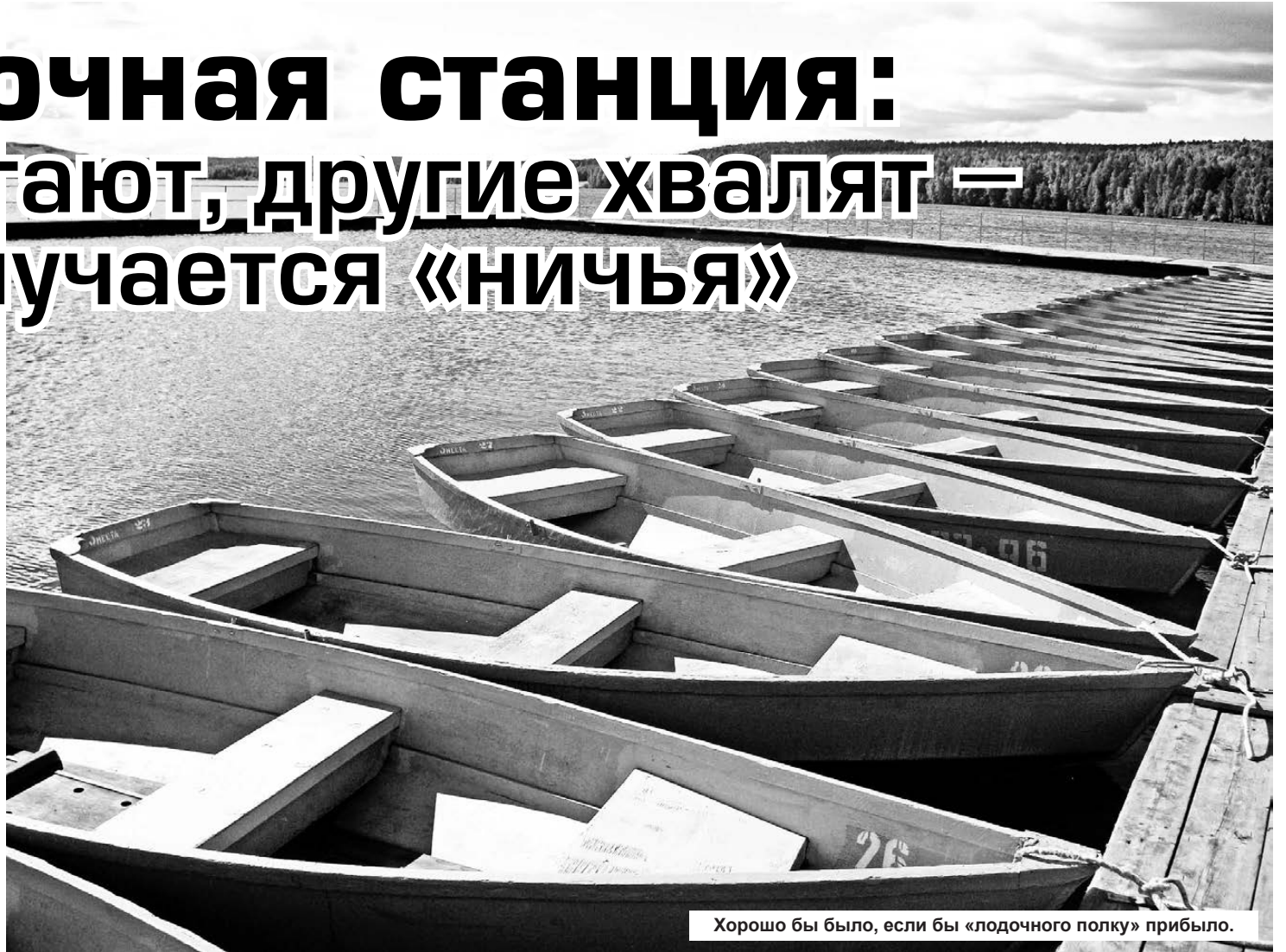
Хорошо бы было, если бы «лодочного полку» прибыло.