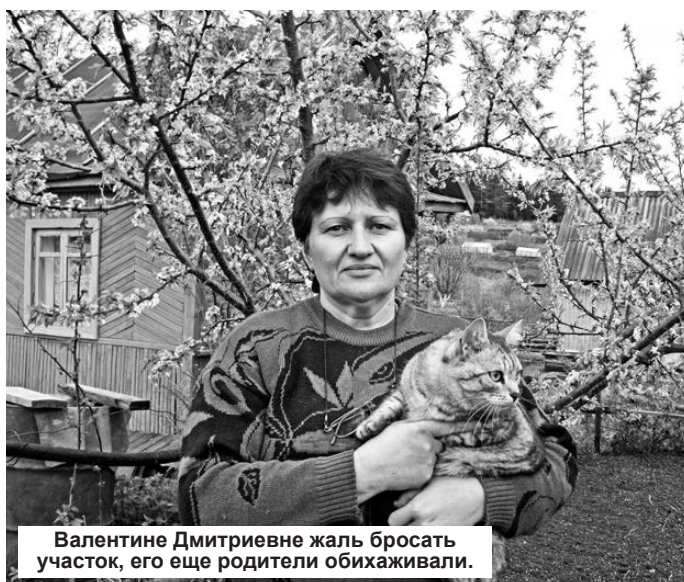
Валентине Дмитриевне жаль бросать участок, его еще родители обихаживали.