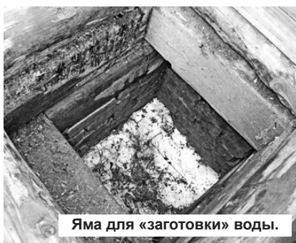
Яма для «заготовки» воды.