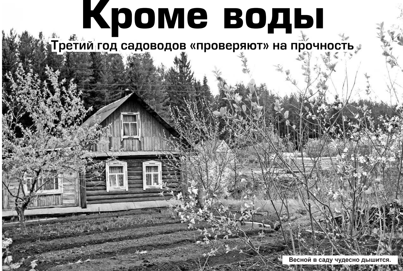
Весной в саду чудесно дышится.