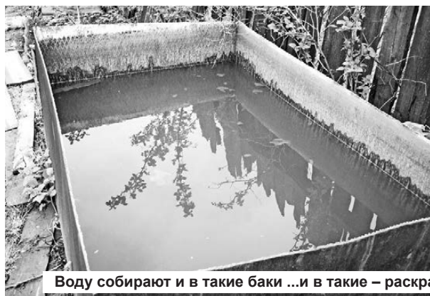
Воду собирают и в такие баки ...и в такие – раскрашенные для настроения.